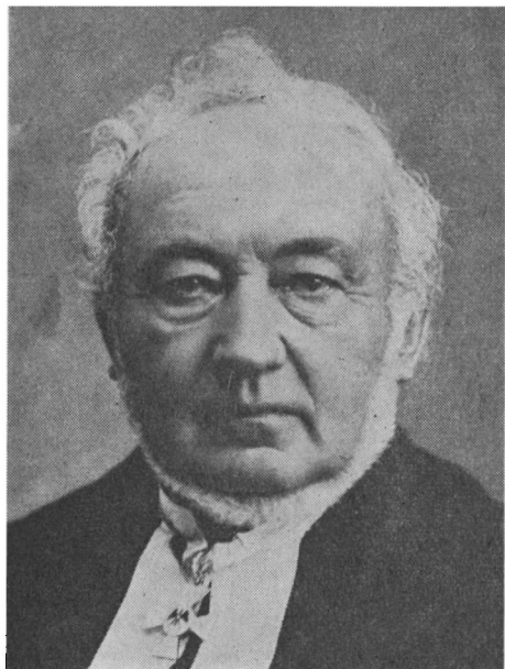
Bertel Petersen Godt (f. 1814 i Rinkenæs, d. 1885) var landmandssøn, studerede i Kiel. Under treårskrigen deltog han — mere moderat end flertallet af de slesvigske gejstlige — i protestbevægelsen mod den danske regering, men blev dog afskediget 1850. Han blev da præst i Ruhr-egnen indtil 1864, hvorefter han blev biskop for Slesvig stift. Som flittig og respekteret visitor øvede han stor indflydelse på kirkelivet.

lagt til Kiel i september 1867. De såkaldte kirkedage havde deres oprindelse i året 1848, da håbet om Tysklands enhed bredte sig, men samtidig radikale kredse under revolutionen krævede adskillelse af stat og kirke. Man frygtede, hvad der ville ske, hvis kirken stod uforberedt på at skulle ordne sine egne anliggender. Man ville derfor prøve at få dannet et kirkeforbund af lutherske, reformerte, unerede og herrnhuter. Dette lykkedes ikke, men konferencerne fortsatte dog regelmæssigt indtil 1872. Kirkedagens sammensætning — den kaldes blot evangelisk — gav den et unionsvenligt præg. De to biskopper fra hertugdømmerne nægtede derfor at være med i den lokalkomité, der stod for arrangementet i Kiel, fordi »stemningen i vort land ikke er homogen med kirkedagens«. Men de benyttede lejligheden til for dette større forum at tale unionen imod. Koopmann advarede mod »at slynge unionens brandfakkel ind i vort fredelige land og nøde kirkens tjenere til at gå fra embede og brød«. Da der også fra anden side faldt hårde ord mod unionen og de reformerte, skønt der var folk af begge retninger til stede, erklærede Godt mere afdæmpet, at ethvert skridt i retning af unionen ville,