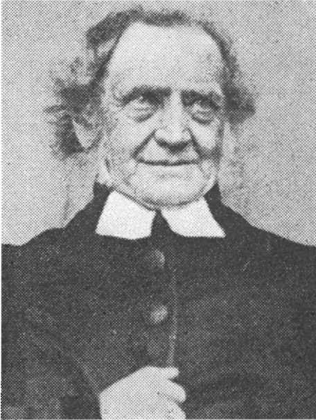
Claus Harms (1778-1855) blev teologisk kandidat i 1802 og var fra 1806 diakon ved Lunden kirke i Ditmarsken. 1816 kom han til Kiel som archidiakon ved Nicolai kirke. 1834 blev han dr. phil. et theol. honoris causa ved universitetet i Kiel. 1835 provst for Kiel provsti.