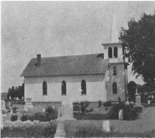
Kirken i Fredsville, Iowa.

ovre, idet det skarpe opgør mellem Indre Mission og Grundtvigs tilhængere herhjemme i disse år, koncentreret henholdsvis om bibelordet og livsordet, også forplantede sig til nybyggerkirken i Amerika og her under de rådende frikirkeforhold i 1893 førte til en bitter spaltning i en indremissionsk og en grundtvigsk kirkeafdeling. Thomsen synes ikke videre at have deltaget i denne usmagelige præstestrød, hvor pietistisk snæversind mødtes med grundtvigsk frisind. Han hørte naturligvis hjemme i den grundtvigske lejr. Til gengæld har han i stilhed samvittighedsfuldt passet sit embede — med gudstjenester, kirkelige handlinger, frie kirkelige og folkelige møder, sjælesorg og kristendomsundervisning.