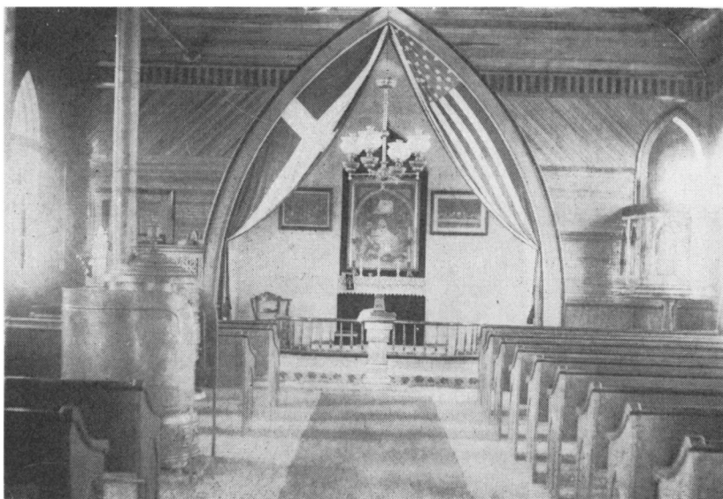
Fredsville kirkens indre.