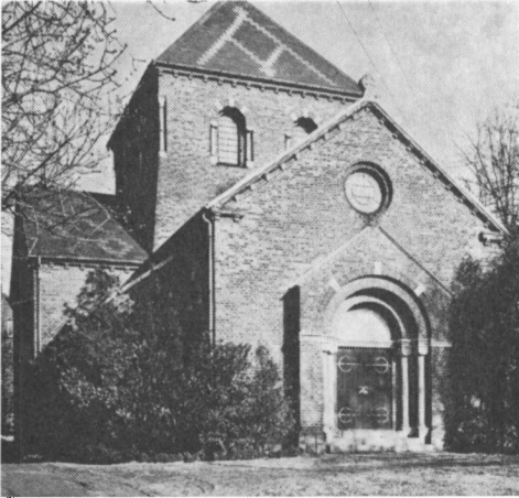
Kristus-kirken i Haderslev.

formidling) havde skænket 10.000 kr. til kirkens opførelse. Da var sorgen slukket.