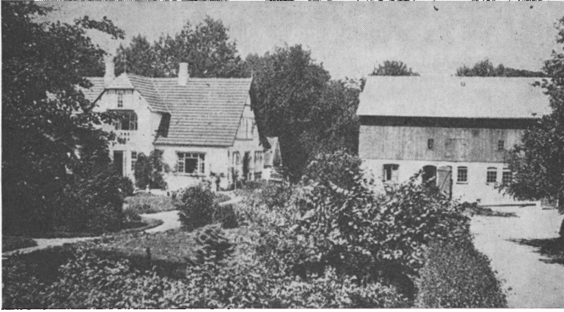
Peder Moos' gård - fot. 1911.

Han var nu slet ingen dårlig person og blev temmelig respekteret, inden han flyttede fra sognet.