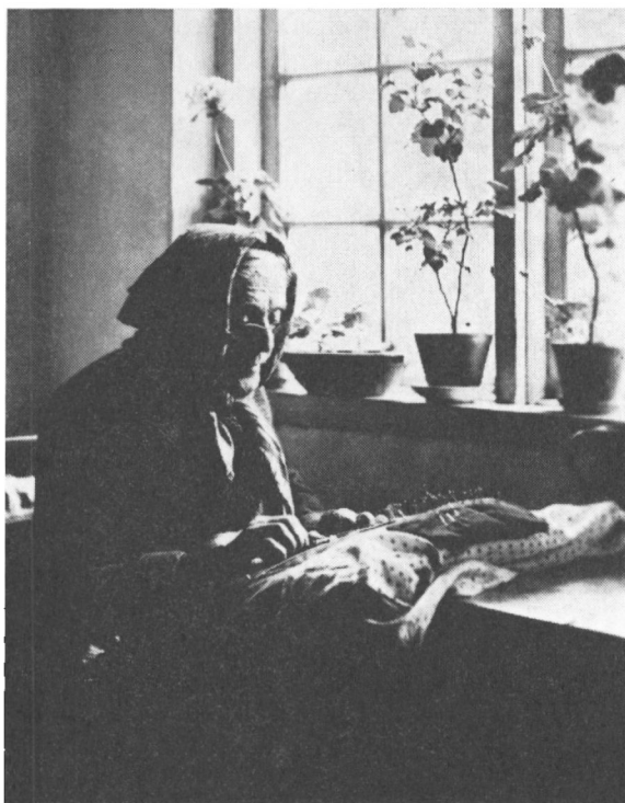
Fig. 3. Gammel kniplerske (fot. 1912 af afd. godsinspektør Davidsen, Møgeltonder).

tråden løb under spoling, anvendtes »æ slæwbrev«, et stykke papir.