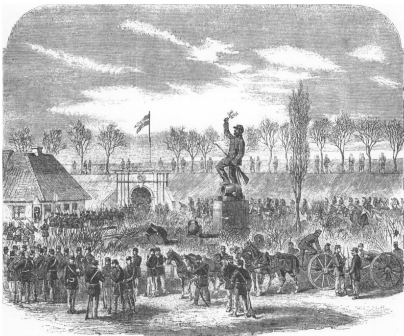
Scene bag Fredericias volde. Soldaterne rykker ud af byen for at komme deres nordligere betrængte landsmænd til hjælp - under træningerne ved Vejle 8. marts. Efter træsnit i Ill. London News 2. apr. 1864, skabt på grdl. af en tegning, som en dansk ingeniør Nielsen i Fredericia har sendt bladet. (Efter T. Vogel-Jørgensen: „Krigen 1864“).

Træsnittene og litografierne er som historisk kildemateriale betragtet af stærkt varierende værdi. Frederiksborgstilens billeder fra 1864, som museet viste frem på en nydelig udstilling, er gennemgående svagere repræsenteret i fremstillingerne, og deres værdi som historisk billede er da også for en hel dels vedkommende ringe. De fortæller ofte mere smagshistorie end Danmarkshistorie.