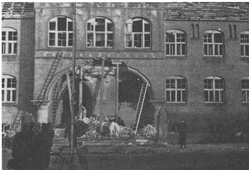
Som hævnaktion for sabotagen mod „HAMAG“ og Åbenrå Motorfabrik i februar blev politistationen i Åbenrå udsat for „schalburgtage“ den 5. maj 1944, foretaget af Gestapo. Ødelæggelserne var meget store, som det fremgår af billedet af indgangsportalen.

I Åbenrå var man sikker på, da man skred til udførelsen af de forberedte aktioner, at nu kom invasionen — den længe ventede.