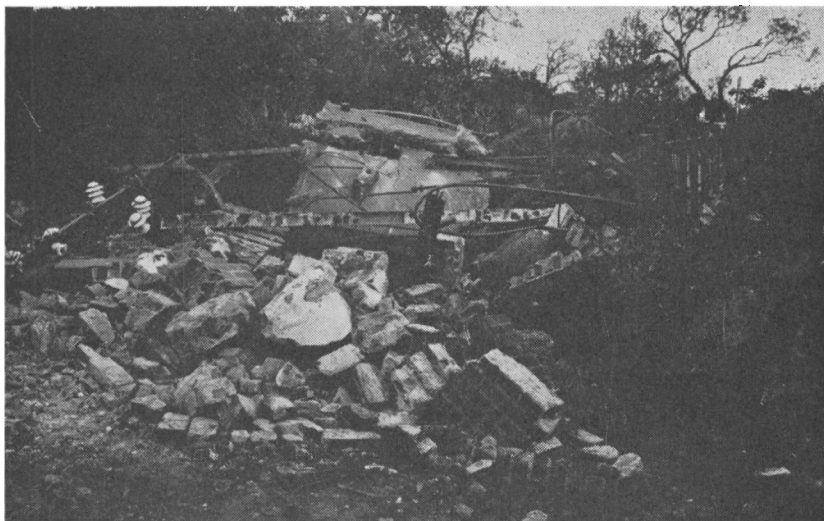
Resultatet af sabotagen mod transformatorårnet i Stollig natten til den 15. okt. 1943.

Strejkebevægelsen begyndte i Esbjerg, brød derefter ud i samtlige fynske byer med Odense i spidsen og bredte sig videre til en række jyske — især nordjyske — byer og nogle sjællandske. Den virksomste faktor i denne bevægelse var kommunisterne, uden hvis dygtige arbejde strejkerne ikke ville være blevet etableret, endsigse gennemført i det omfang, der faktisk blev tilfældet. 9 Hele denne bølge af strejker gik imidlertid uden om Sønderjylland. Ikke et eneste sted i denne landsdel kom det til røre eller uroligheder, der hævede sig op over nogle rudeknusninger og sammenstimlinger på gaderne. Denne konstatering gælder også for Åbenrå, hvor alt, hvad der hændte af ekstraordinært i de kritiske dage, var følgende: