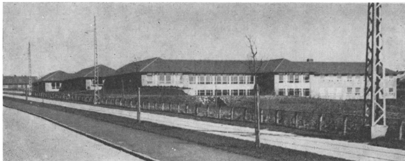
Sønderskovskolen i Sønderborg.