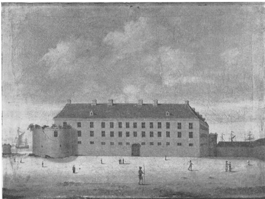
Sønderborg Slot ca. 1750.

opgave at råde hod herpå, og det er en opgave, som bør tages op snarest«.