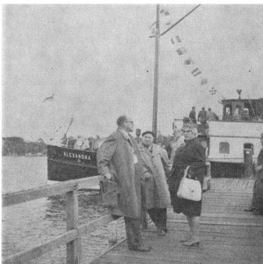
Ved anløbsbroen i Arnæs

9 rundede S/S Alexandra, fyldt med forventningsfulde deltagere, Sønderborg Slot og stod syd på. Vejret var behageligt, og ingen blev søsyge trods nogen vind. Traditionen tro faldt der ikke regn på turen.