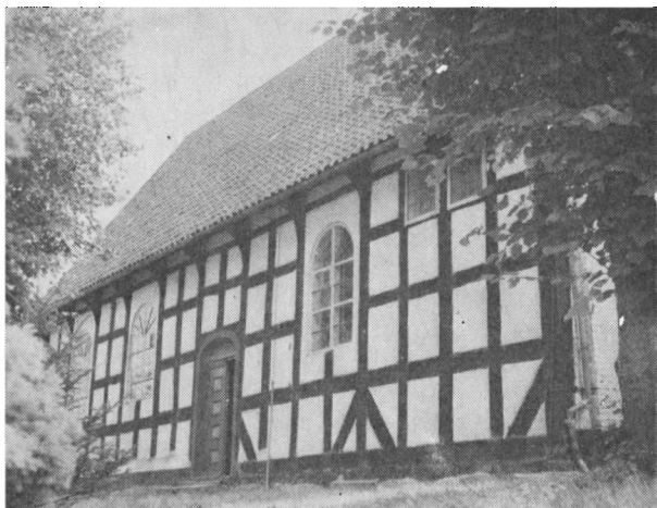
Kirken i Arnæs med dens særprægede bindingsværk

rundspørge blandt deltagerne at vende før jernbanebroen, således at man kunne være tilbage i Sønderborg til det fastsatte tidspunkt kl. 20,00.