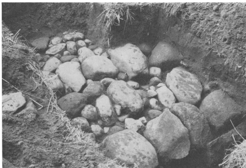
Kapellets fundament set fra øst.