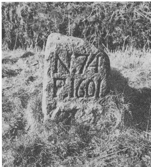
På den øverste fiskedams vold står idag endnu denne grænsesten med årstallet 1601.

medlem af Hellig Legemsgilde i Flensborg og findes i fortegnelserne over medlemmerne for dette år.