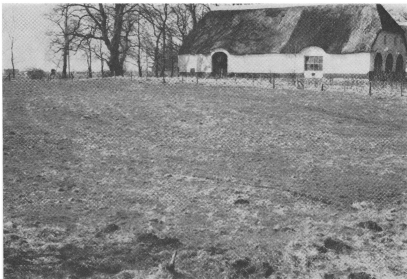
Klusgårds sydlige lade set fra syd. Mellem det store træ og laden har kapellet ligget. Rækken af hegnspæle foran laden fører lige over det fundament, der muligvis har været en præstegård.