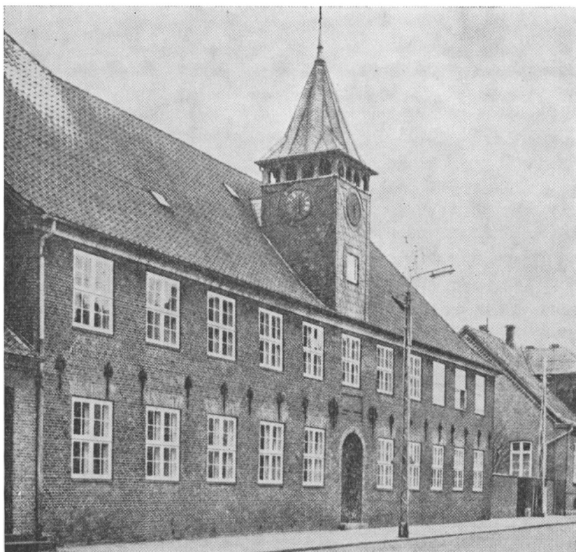
Helligåndskapellet i Tønder, der i sin bagbygning rummede vajsenuset

året. Men fra 1738 og til sin død i 1771 virkede Rakebrandt som både økonom og lærer. Samtidig forestod han salget og udsendelsen af forlagets bøger. Ved sin tiltrædelse opstillede han en udførlig inventarfortegnelse, som endnu er bevaret.