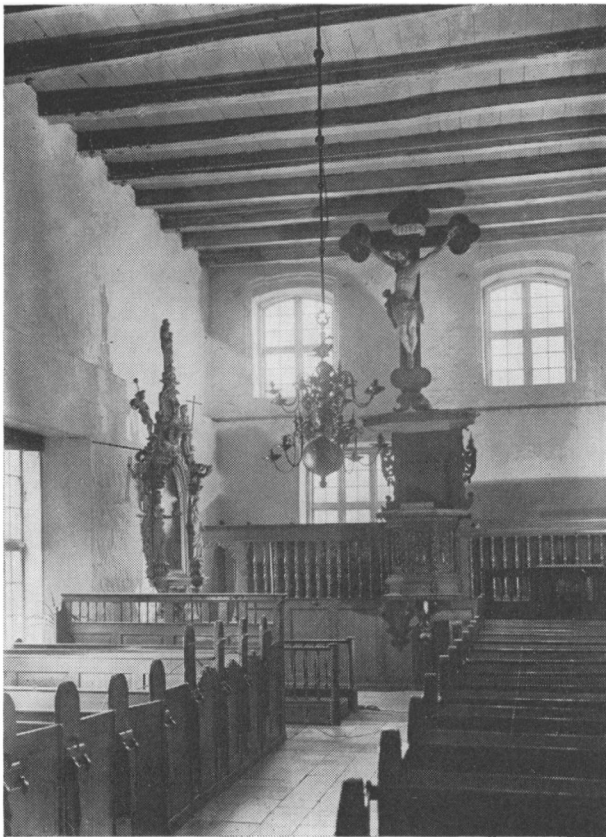
Klosterkirken i Flensborg

dianen, om de havde fået en ny guardian. Han svarede, at det forholdt sig således; man havde nemlig som forstander indsat en borger i Flensborg, som tidligere havde boet i Vejle, og hvis ejendom der var brændt (vistnok i 1524, da der var en stor brand i Vejle, som ødelagde en stor del af byen). Amtmanden satte egenhændig denne mand på porten og gav guardianen klostrets nøgler tilbage.