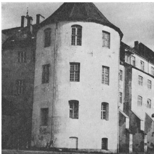
Det kraftige, runde tårn, hvor vestfløjen mødes med nordfløjen.