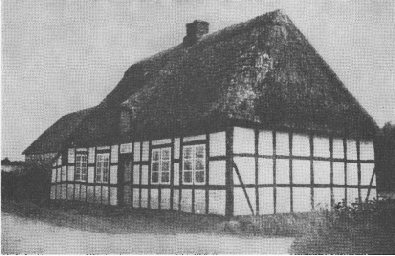
Distriktsskole i Norby, Krop s., opført 1833. Efter Krauss: »Geschichte des Kirchspiels Kropp«

de i 1820 omdannedes til normalskole for begge hertugdømmer. Der var på ny skabt et tysk kulturcentrum i Sydslesvig; thi i de følgende år aflagde et stort antal lærere besøg i Eckernförde for på kursus af 14 dages varighed at blive præpareret med kendskab til den nye metodes kunstfærdige, eksercitslignende teknik og dens materialer 10 . 1845 var den indbyrdes undervisning indført ved 306 skoler i Slesvig og delvis ved 159 11 .