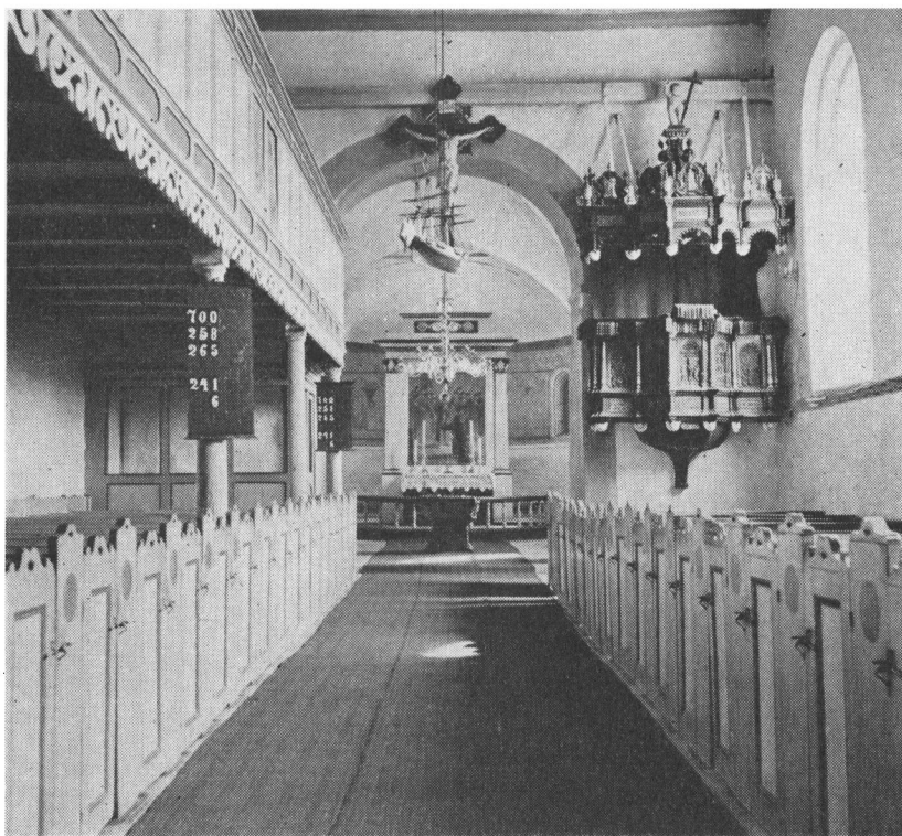
Ballum kirkes indre. Prædikestolen udført af tøndersk mester er fra 1600. Herfra har altså også hr. Anker talt.

slægt og gode venner, og måtte flytte ind i et øde hus«. Som en anden tvingende grund til at han måtte rejse væk, anfører han: »Item der jeg af Guds underlige forsyn og venners råd vil begive mig i det hellige ægteskab, så kan vel enhver vide, at jeg ikke kunne gribe det så hastigt an, at det jo ville have tid og rum, og jeg kunne ikke sidde hjemme ved min skorsten sådant at forrette.« Og han fortæller, at hans bryllup stod langt borte fra sognet.