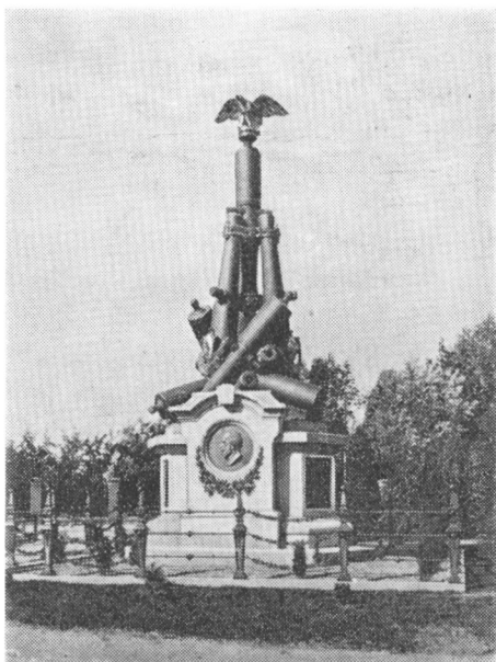
Kanonmindesmærket, nedbrudt til omsmelting i 1941.

sønner af vor snævrere hjemstavn. Særlig husker jeg sønnen af en bagermester i Bøgelund i Angel, som havde overlevet 1. verdenskrig som underofficer og nu fandt døden her. Med hans broder havde jeg haft godt kammeratskab på vestfronten i 1918. Senere hørte han til de mest aktive medlemmer af Rigsforbundet for Krigsinvalidler, og vi vedblev at være venner. Så slyngede er skæbnens tråde ofte blandt mennesker.