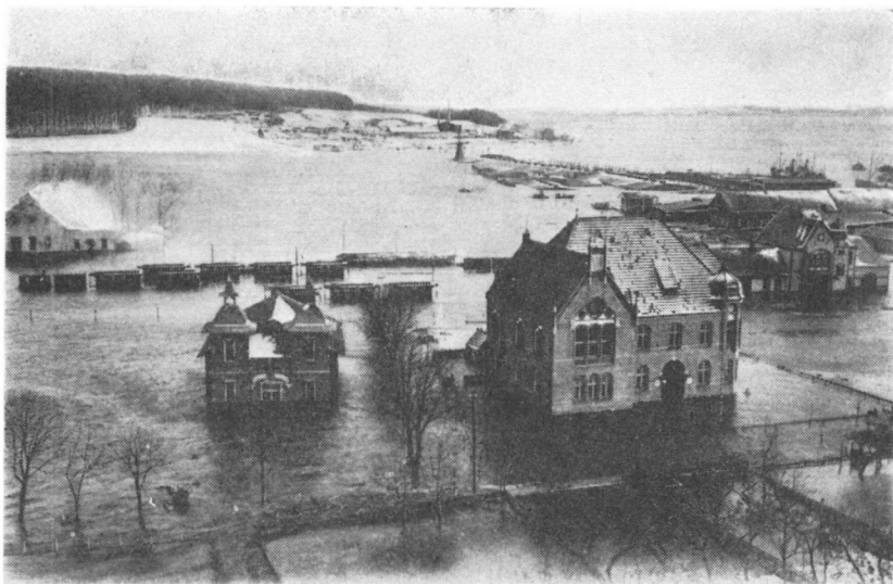
Billede der viser oversvømmelsen nytårsnat 1904/05. Man ser hele arealet omkring amtshuset og rulebilstationen (den daværende amtsbanestation) under vand. Træbygningen ved siden af amtshuset er »Turnhalle«, den blev senere flyttet ud på stadion og endte sin tilværelse som husvildebarak.

blad har endog i en længere serie bragt billeder fra arkivet, hvorved interessen blandt publikum har vist sig at være stor for sagen, og mange har afleveret deres billeder til samlingen, når de igennem aviserne har erfaret, at vi var interesseret i dem.