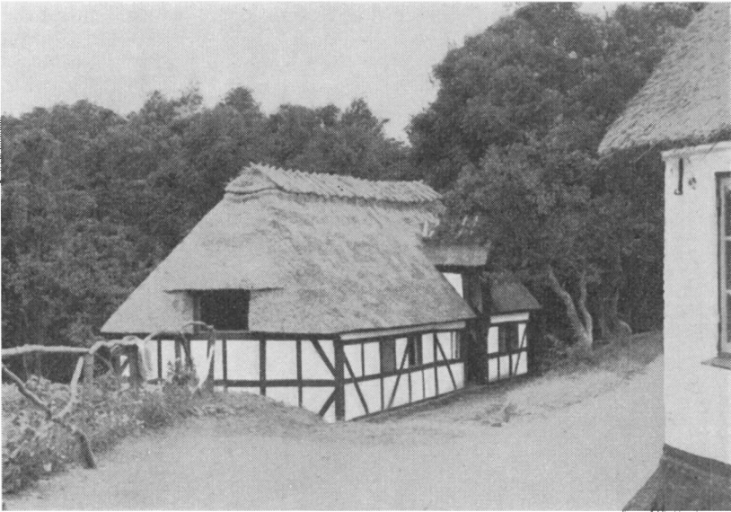
Vibæk mølle.