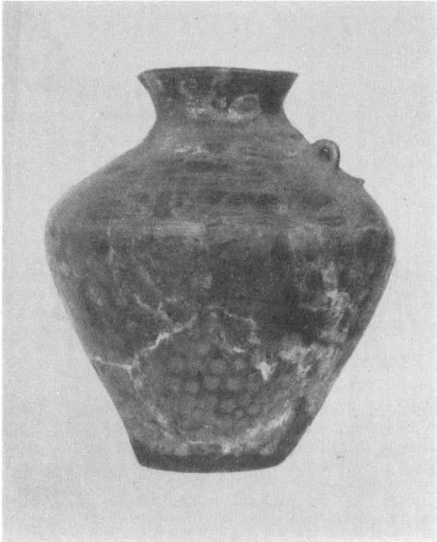
Fig. 3. Lerkar.

med oldsager: 7 stykker af tykke jernstænger, 2 spydspidser, 2 hankeringe til et stort kar, 2 sporer, skjoldhåndtag og skjoldbule, kniv, spænder, sværd og et par ornamenterede sølvbeslag. Desuden nogle fåreknogler. — Altså ingen gravurne, men et særligt værdifuldt offer nedsat i offerdyngen.