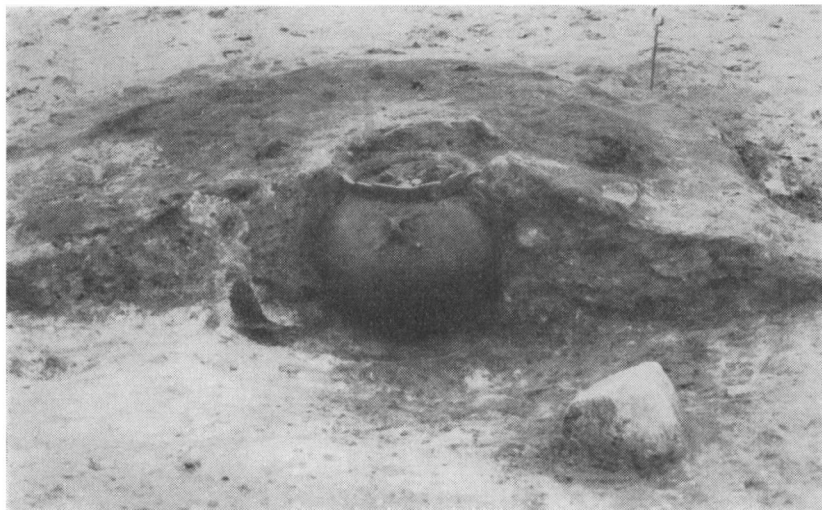
Fig. 4. Det centrale lerkar under bålresten.

rundt om dyngen og først derpå brolagt overfladen. Vi ved ikke, hvornår brolægningen er sket.