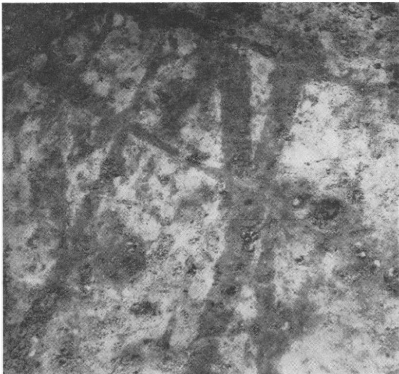
Fig. 6. Pløjestrøber i den lyse undergrund.

ken skulle først være bygget der på Gasse mark. 7) Noget østligere på Gasse mark huskes en stor sten, som hed offersten.