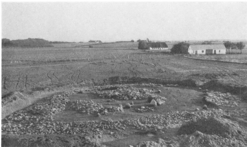
Fig. 2. Offerplads, fra nord.

men de lå ganske spredt, og hjemme i museet viste sig det mærkelige, at de ikke kunne samles til hele kar. Ret hurtigt samlede vi to små skåle af ældre romertids form, og af dem var næsten alle skår bevaret, men af de andre mange fik vi ikke så meget som en skårflage til trods for, at der var ornamenten og former nok at rette sig efter. Hvorfor fandt vi af de to skåle næsten alle skår, men af de andre hundreder af kar kun et? Målt med vore mange andre erfaringer kommer man ikke uden om, at den nærliggende tanke, at skårene er de ituslåede kar, som man kom med offergaver i, må afvises. Man har ikke ofret hele lerkar, men skår. Det er indenfor religionshistorien ikke ukendt, at man fandt det tilladeligt i stedet for et hele at ofre en erstatning eller en lille del, og netop Kastrupfundet vil senere vise ét sikkert eksempel på den samme tanke.