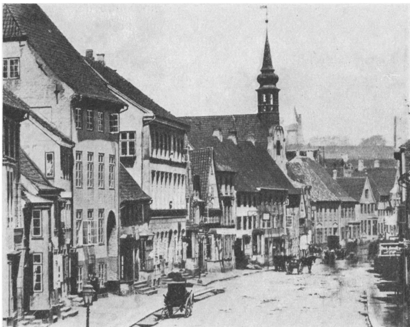
Storegade med Helligaandskirken omkring 1875.

blive. Skolen tæller alt i alt en 130 Børn. Intet Barn faar mere Lov at blive optaget i Skolen, saa den er nødt til at ophøre af sig selv. Nissen er min Hjælpelærer, han er altsaa ogsaa foreløbig reddet.