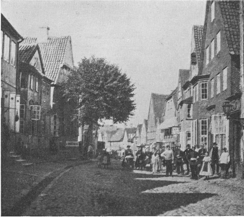
Nørregade omkring 1865.