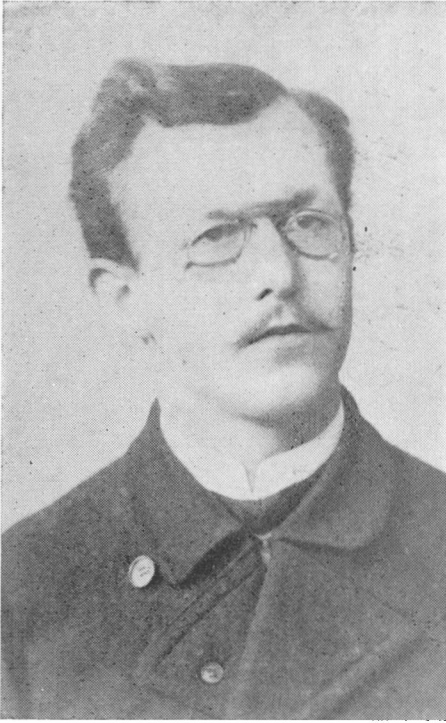
Student i Kiel

blev herefter min vejviser. Jeg modnedes i nærheden af korset«, siger han selv.