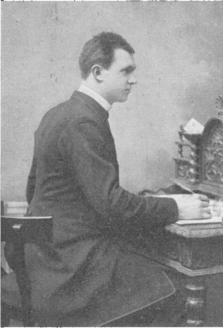
Lære vikar i Sommersted

tjenesten ved graven. Der var 1.000 tilstede ved mindesamværet i Borgerforeningen.