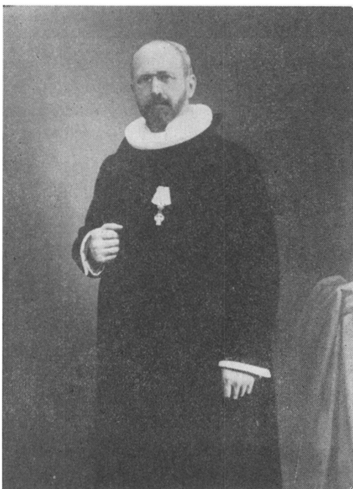
Sognepræsten i Magstrup 1924