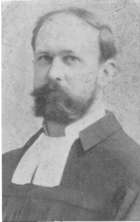
Præst i Brarup