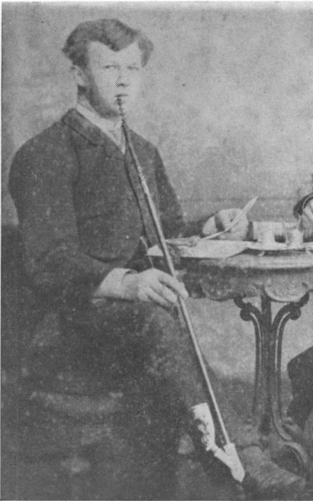
Latinskoleelev i Haderslev