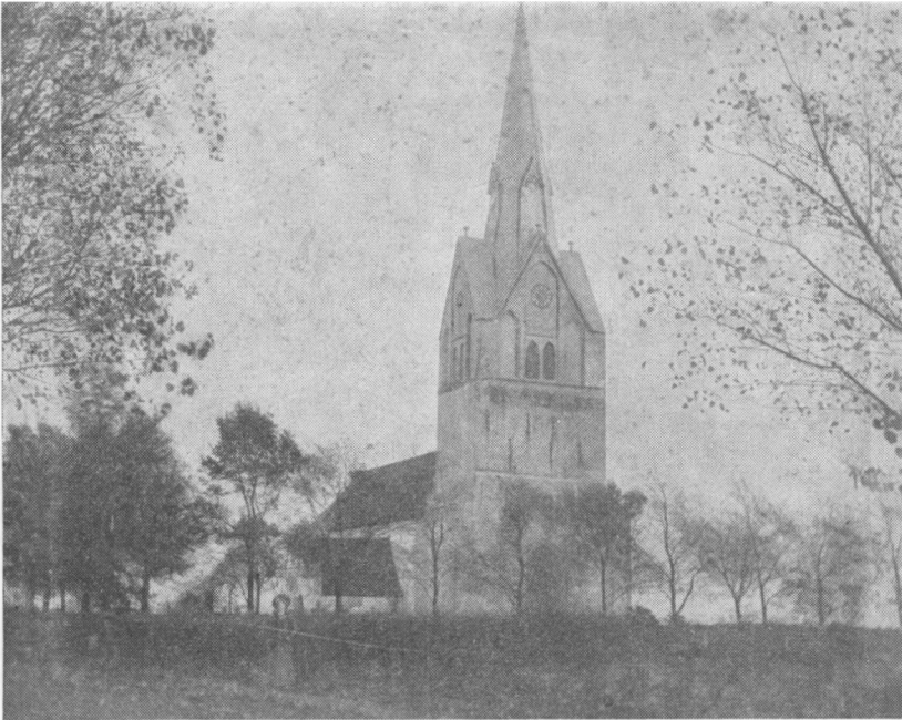
Brarup kirke før ombygningen, tårnet fjernet i 30'erne af hensyn til Læk styvepæds

deres nationalisme åbenbart ikke ret forstod hans vanskelige stilling som præst i den tyske statskirke. Man modtog ham høfligt og gæstfrit, roste hans gode danske sprog, men betragtede ham alligevel som en frafalden, idet han ikke åbent kunne give udtryk for sit danske sindelag. At han stod som »det danske sprogs sydligste vagtpost i Slesvig, kunde vel have interesseret en og anden, ikke for personens, men for sagens skyld. Thi det var en af de bedste og tillige tungeste følelser, jeg stod med i Brarup, at jeg havde tjenesten som den danske kirkes yderste forpost. Og det var en ensom post«. Ingen af hans nabopræster kunne tale dansk. Der taltes da også stundom lidt spottende om »det danske Brarup«.