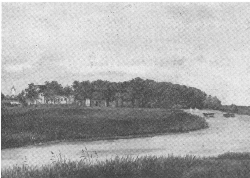
Brøns mølle med kirken i baggrunden. Maleri — formentlig kopi. Ukendt kunstner Sikkert fra tiden op mod århundredskiftet.

stod i spidsen for oprettelsen af en dansk højskole i Brøns; den fik dog kun en kortvarig virksomhed. Den åbnede 1868, men blev lukket af tyskerne 1871. Sammen med P. Skau, Bukshave, var han i sommeren 1883 fører for de sønderjyske pigers rejse til København. Det var en prægtig tur, men stillede store krav til de to føreres talegaver.