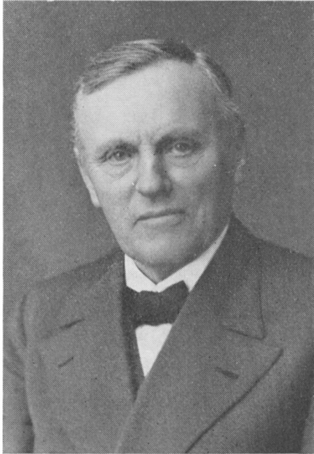
Aage Jacobsen, 1877—1948.

mindre værker. Det havde kraft nok, og der blev i en årrække ikke meget for møllen at gøre. Dog blev ledningerne sammenkoblede, så møllen dels kunne bruge strøm fra højspændingen, dels kunne tilbagebetale dette forbrug, når vandmængden tillod det. Under den anden verdenskrig, da brændelsvanskelighederne satte ind, steg produktionen af elektricitet betydeligt. Højspændingsværket fik brug for al den hjælp, som vandkraften kunne yde.