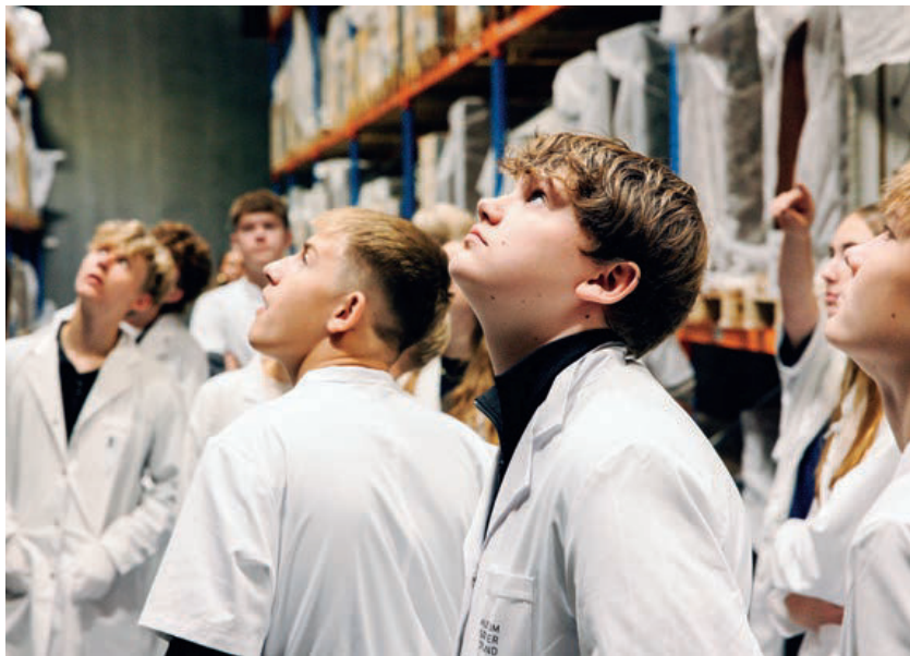
Skoleelever på besøg i Bevaringscenter Sønderjylland. Med støtte fra de fire sønderjyske kommuner lancerede museet fire formidlingstilbud i trekanten mellem naturvidenskab, arkæologi og kulturhistorie. Over en projektperiode på 18 måneder deltager 60 skoleklasser.

Museum Sønderjyllands samarbejde med Aabenraa Kommune omkring udarbejdelsen af et nyt prospekt for et museumsbyggeri på hav-