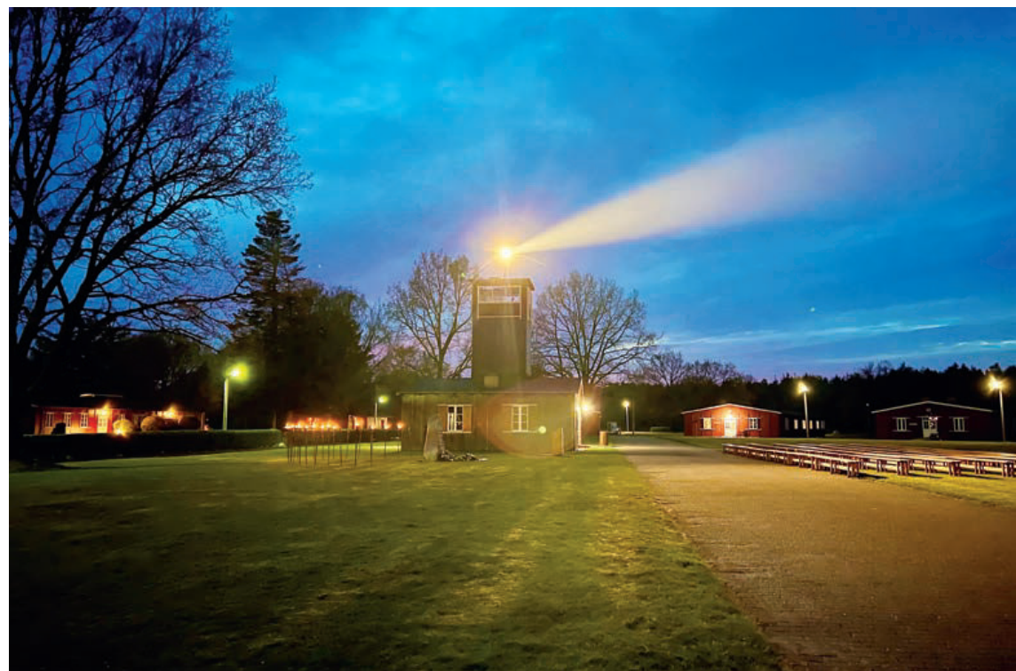
Projektøren tændt en mørk aften.

Igen flere år har det været et stort ønske at få genskabt lyset i lejrens ikoniske projektør. Den sendte fra sin plads på hovedvagtårnet sit lange lys ned langs barakkerne fra lejrens begyndelse i 1944. Den lange tid på taget har dog også slidt på den originale projektør, der måtte tages ned i 2021. Den står nu beskyttet mod vejr og vind og skal