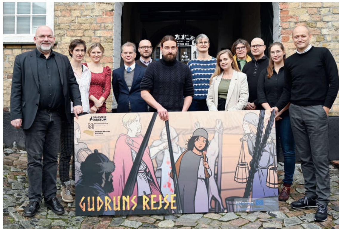
Danevirke Museum har udviklet undervisningsmateriale om vikingetiden sammen med Kongernes Jelling, Vikingemuseet Hedeby og historiedidaktiske eksperter fra Universitetet i Flensburg og CVL i Jelling.

DAMU's formidlingsarbejde har ikke mindst nydt godt af, at formidlingen siden foråret 2023 er blevet styrket med hele to fastansatte museumspædagogiske medarbejdere (på lidt mindre end 1,5 stillinger). Dette har ikke kun givet bedre muligheder for at servicere skoleklasser og andre besøgsgrupper, men også gode rammer for at videreudvikle skoleprogrammet. Efter et skifte i stillingen som ledende museumspædagog er programmet atter blevet udviklet og differentieret både for danske og tyske skoleklasser. Som led i det dansk-tyske museumssamarbejde, som DAMU ser sig selv som motor for, har vi desuden i 2023-2024 udviklet et fælles undervisningsmateriale om vikingetiden med Vikingemuseet Hedeby og Kongernes Jelling. Det bygger videre på fortællingen i den fælles animationsfilm "Gudruns Rejse". Et elevhæfte i tegneseriestil,