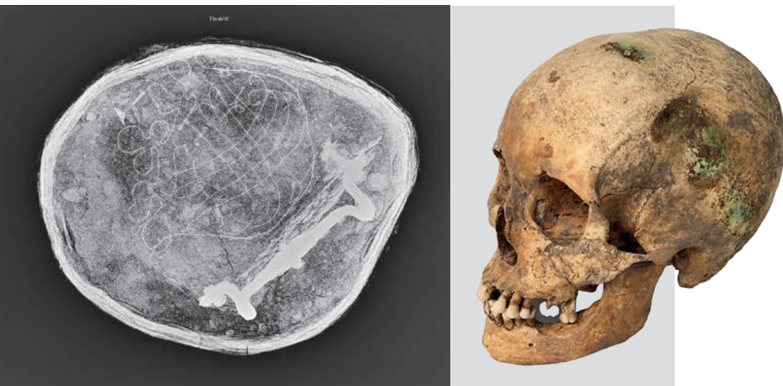
Røntgenfoto af de fine, snoede kobbertråde, der danner Jomfrukronen fra Aabenraa. På billedet ses også et kistehåndtag. På det løsfundne kranie fra kirkegården ses grønne mærker efter kobber, der går i en krans omkring kraniet. Disse jomfrukroner var åbenbart almindeligt brugt på kirkegården ved Skt. Nicolai Kirke.