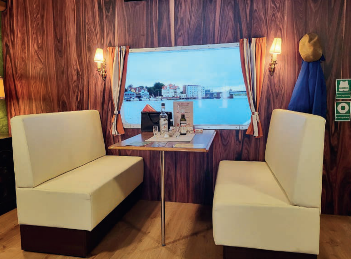
Museets "spritbåd", indviet i foråret 2023. Her kan gæsterne få sig "en tur med æ' spritte" og genopleve stemningen fra sejlturene på Flensborg Fjord.

Sæsonen 2023 gik sin gang med de faste ferieaktiviteter samt vores æbledag (de sønderjyske frugtsorter og deres historie arbejder vi stadig med), der som sædvanlig var gode tilløbsstykker.