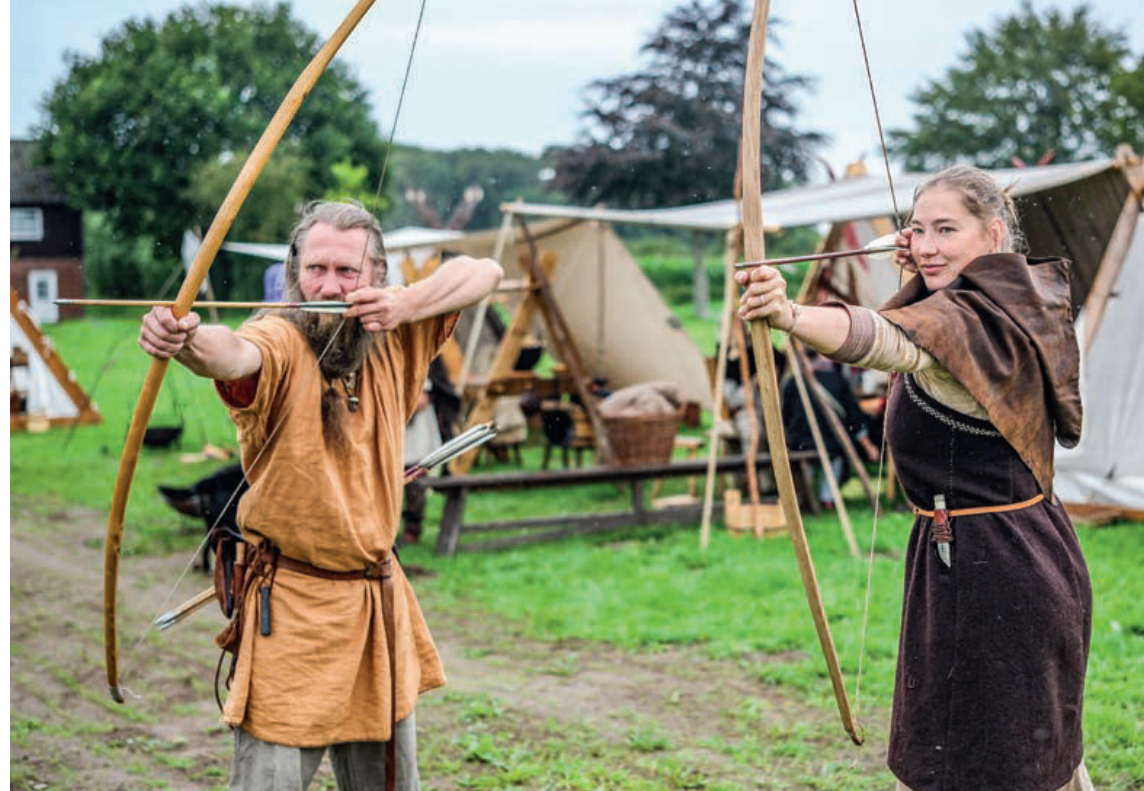
Bue og pil stod i centrum på Danevirke Museums største arrangement i sommeren 2023.

Udgravningerne umiddelbart omkring besøgscentret, der forberedte både det omtalte minigolfanlæg og en udvidelse af den offentlige parkeringsplads i 2025, vakte stor opmærksomhed om museet. Archäologisches Landesamt (ALSH) fandt her spor efter to langhuse, der var orienteret mod Hærvejen og lå få hundrede meter foran Danevirkes port. De blev dateret til omkring år 1200 og dermed til Valdemarernes tid. Dette faldt fint i tråd med museets aktiviteter i foråret 2023, hvor der netop var blevet fokuseret på denne periode og Valdemar den Stores teglstensmur. DAMU understøttede atter ALSH ved at orientere jævn-