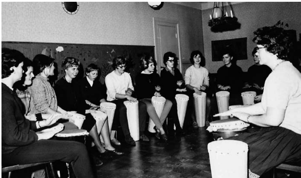
Aktivitets- og kulturfagene havde en fremtrædende plads i pædagoguddannelsen frem til den lov om pædagoguddannelse, der trådte i kraft i 2007. Her er et hold elever i gang med undervisning i rytmik på Nygade 41 i 1960.