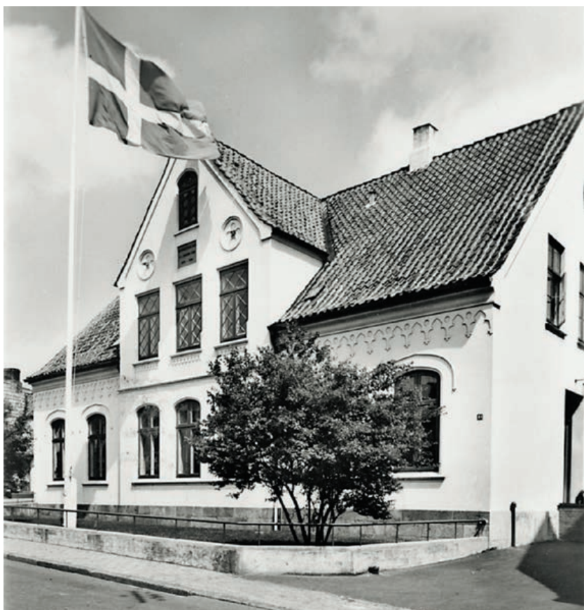
I de første årtier levede Aabenraa Børnehaveseminarium en omtumlet tilværelse. Fra 1957 til omkring 1970 havde seminariet hjemme i H.P. Hanssens villa på Nygade 41.