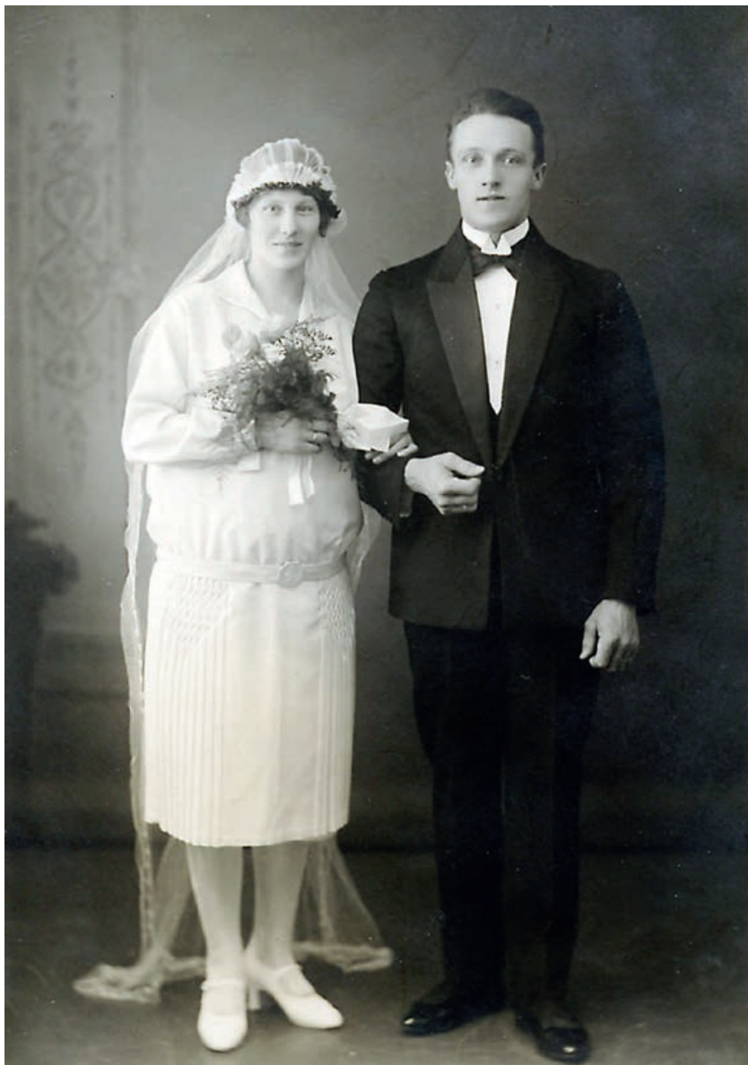
Der er bevaret mange bryllupsbilleder rundt om i de danske lokalarkiver, men det er en sjældenhed at finde ét, hvor bruden glad fremviser sin graviditet som på dette foto fra 1927. Denne brud, der var i sjette måned, og hendes udkårne var henholdsvis 24 og 26 år gamle og behøvede altså ikke et kongebrev.