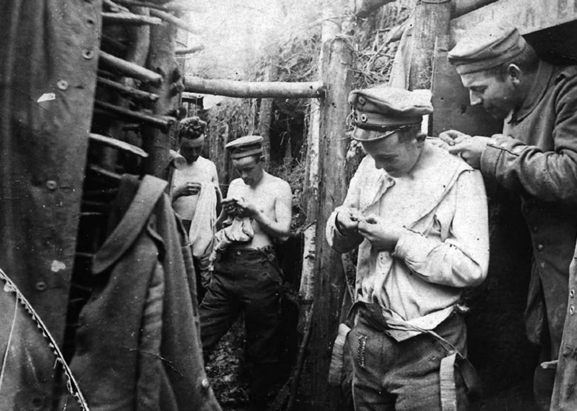
Soldaternes skæbne ved fronten var hovedårsagen til, at den danske regering efter nogen tøven besluttede sig for at naturalisere de hjemløse. Her ses fire soldater i et fredeligt øjeblik i en skyttegrav i færd med aflusning. En menig tjekker kraven på en underofficer.

Tyskland, kunne de tidligere have haft ophold i Danmark og derigennem have aftjent dansk værnepligt. Desuden havde landråden i Haderslev i 1911 opfordret de hjemløse til at lade sig melde til den danske hær, 34 hvad der dog i almindelighed ikke var muligt ifølge dansk ret. Gruppen af hjemløse, der havde aftjent dansk værnepligt, kan ud fra antallet af naturaliserede ifølge Majloven anslås til nogle få hundrede mænd. Sagen blev senest bragt på bane den 1. januar 1916, og her mente gesandt Moltke, at den burde løses ved forhandling med Tyskland. 35 I starten drejede sagen sig konkret om udstedelse af såkaldte hjemstedsbeviser til hjemløse, som havde aftjent værnepligt i den danske hær, men udstedelse af et sådant hjemstedsbevis ville reelt være en af Danmark udstedt fritagelse fra tysk værnepligt, hvilket åbenlyst indeholdt en fare for at skabe "misstemning" de to lande imellem. Danmark indtog det standpunkt, at Tyskland ikke burde indkalde denne bestemte gruppe af hjemløse, da de burde stå til rådighed for den danske hær –