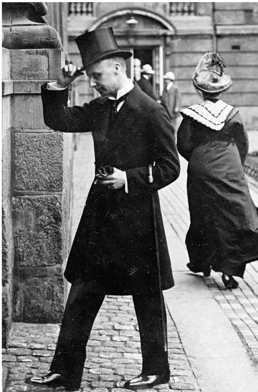
Erik Scavenius (1877-1962) i tiden omkring 1. verdenskrig, hvor han havde sine første perioder som udenrigsminister i 1909-10 og 1913-20.