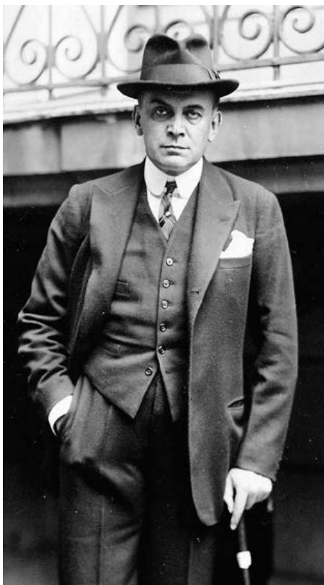
Gesandt Carl Moltke (1869-1935). Ud over at være gesandt i Tyskland under 1. verdenskrig blev han siden udenrigsminister i Staunings første socialdemokratiske regering 1924-26 uden selv at være medlem af Socialdemokratiet.

Artiklen her er baseret på kilder i Udenrigsministeriets Arkiv på Rigsarkivet. 6 Først og fremmest gælder det den journal, som indeholder do-