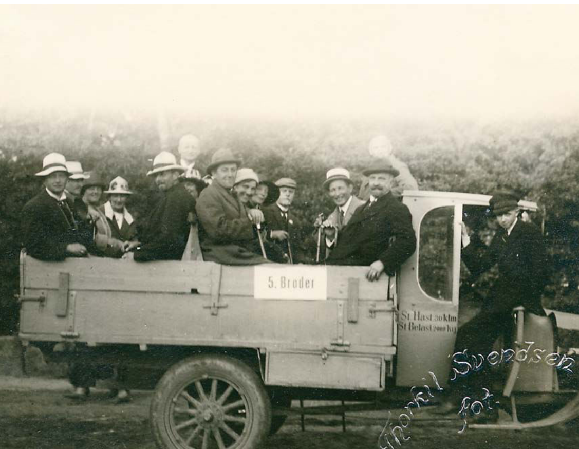
I 2022 fylder Historisk Samfund for Sønderjylland 100 år og udgør altså også selv et stykke historie. Dets indsamling af historisk viden om Sønderjylland foregik i 1925 blandt andet i form af et hjemstavnskursus, som her til vogns i august 1925.