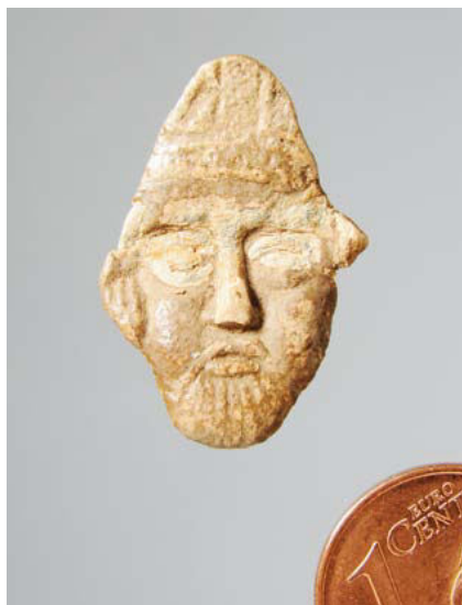
Fund fra Ellingsted.

Danevirke Museum genåbnede 2021 med sin anden særudstilling i anledning af hundredåret for folkeafstemningen om grænsen. Fra grænsekamp til kulturel frihed – 100 år med det danske