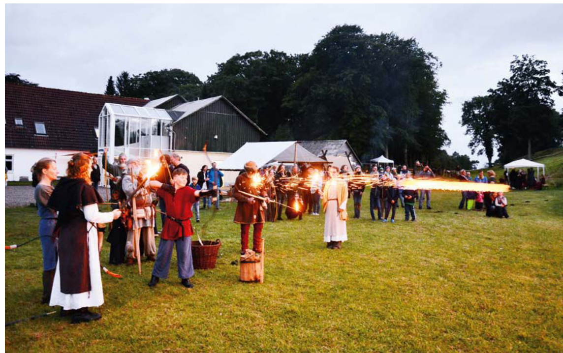
Ildfest på Danevirke Museum.

Da der har været strenge begrænsninger med hensyn til ophold af grupper på museets udeområder i den Arkæologiske Park, har der tilmed fundet yderst få aktiviteter sted her. I september måned var der dog en enkelt mulighed for (med begrænset deltagerantal) at arrangere en "ildfest" med aktiviteter rundt omkring emnet. Med i alt over 200 deltagere bidrog den ikke mindst til at pleje forholdet mellem museet og lokalbefolkningen.