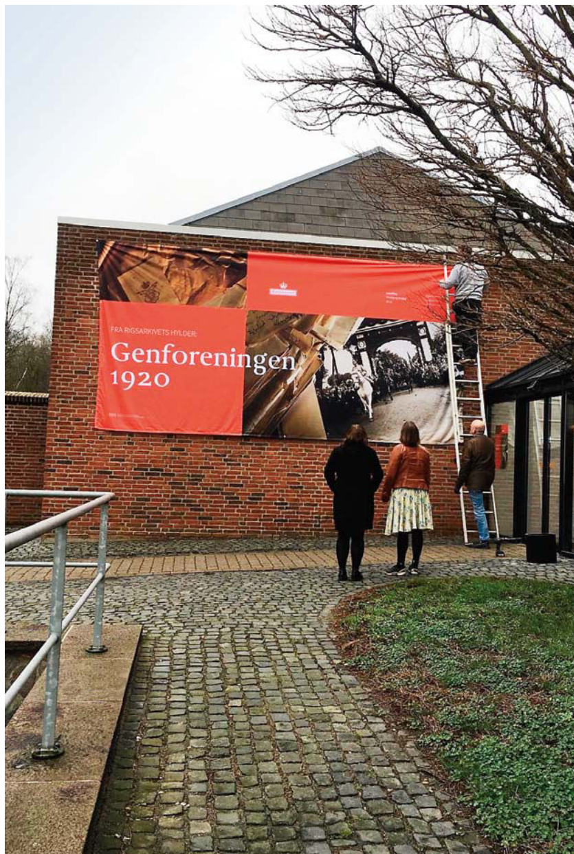
Rigsarkivets plancheudstilling, der åbnede den 24. januar 2020, blev markeret med et stort banner opsat på bygningen ud mod Haderslevvej i Aabenraa.