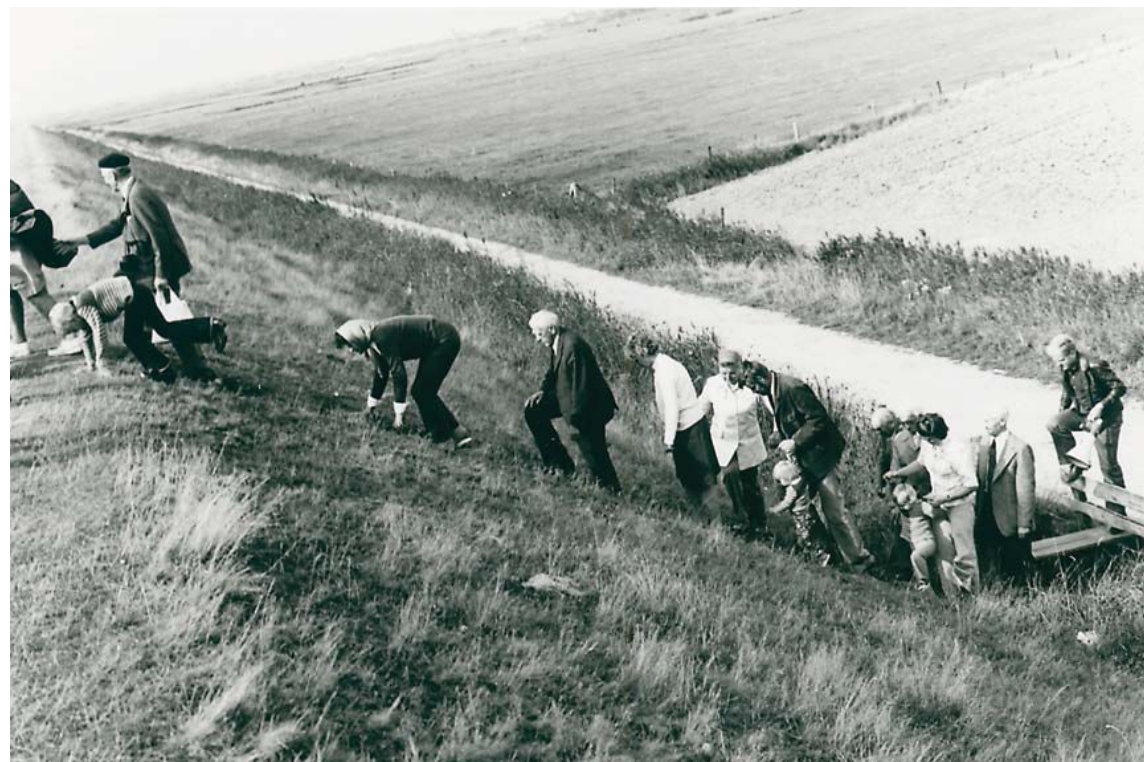
I 1925 drog Historisk Samfund for Sønderjylland på tur til vogns – 50 år senere foregik udflugten med apostlenes heste, da turen gik til Sild.