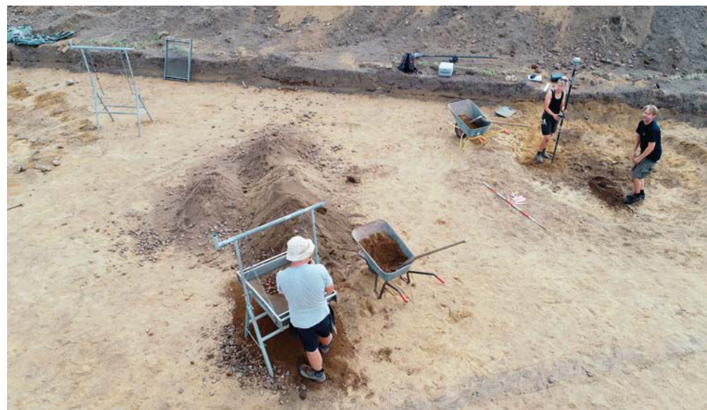
Tre af museets arkæologer under udgravningen ved Herrestedgård, hvor der blandt andet blev fundet flere jordfæstegrave fra bronzealderen.

Af øvrige fundlokaliteter kan fremhæves nogle meget sjældne voldgrave fra ældre bronzealder lokaliseret ved Nybøl. De er sandsynligvis blevet genanvendt i yngre romersk jernalder, samtidigt med våbenofringerne i den nærliggende Nydam Mose. Ved Bolderslev blev der udgravet et muligt soltempel fra den sidste del af stenalderen, og ved Herrestedgård ved Toftlund Kirke blev der udgravet fem fladmarksgrave fra ældre bronzealder, hvoraf én grav rummede rige gravgaver i form