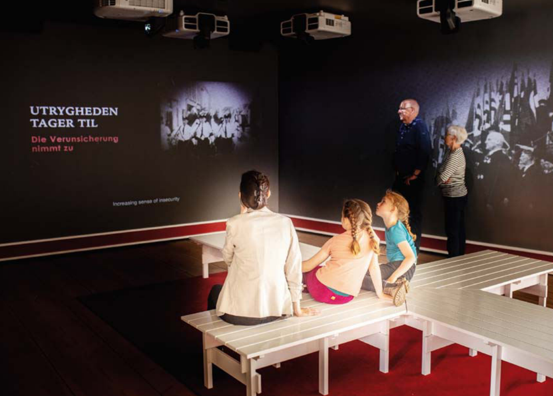
Fra udstillingen 100 år med Danmark – Sønderjylland siden Genforeningen, som er den største udstillingssatsning på Sønderborg Slot i mange år. Her ses det særlige rum til visning af en film på tre vægflader, som sammen med lydsiden skaber en helhedsoplevelse, der tiltrækker gæsterne og fastholder dem gennem fortællingen.