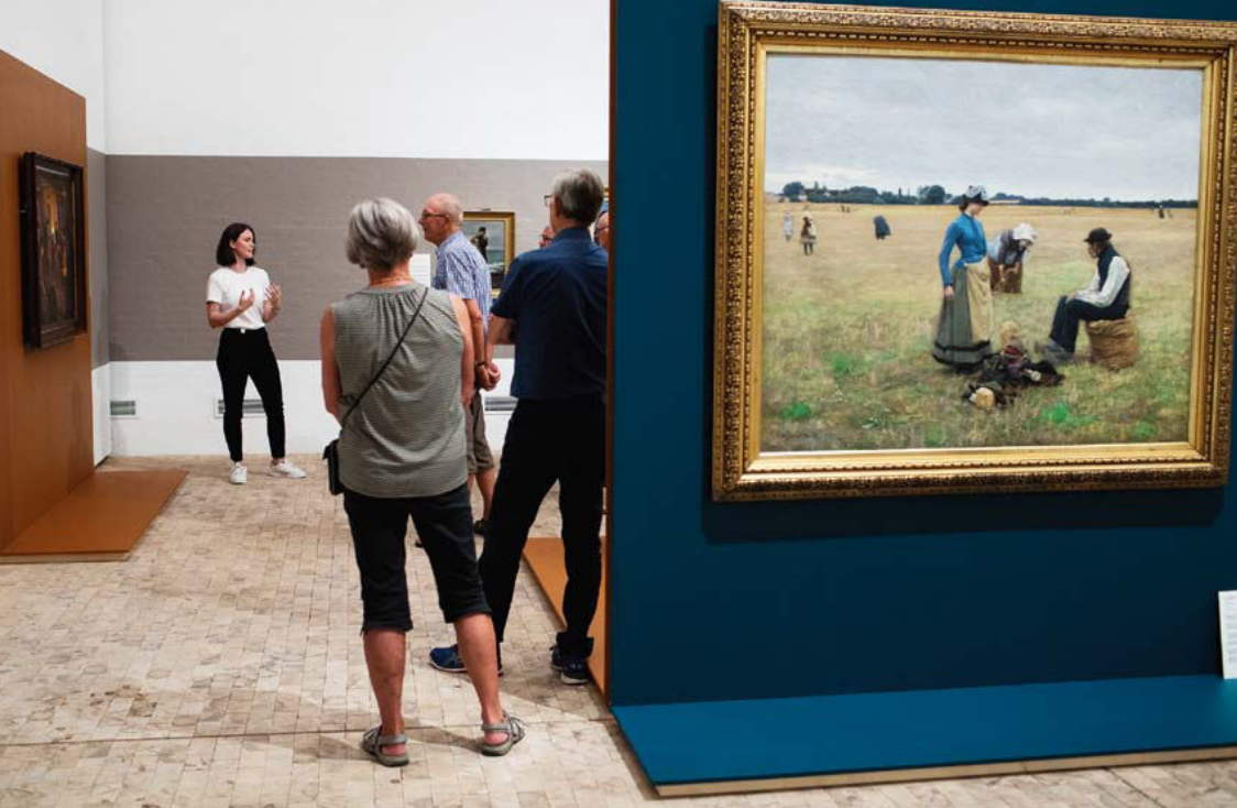
Fra udstillingen Medgang & Modgang: Udvekslinger mellem dansk og tysk kunst . Udstillingen var todelt, således at den ældre kunst (som på billedet) blev vist på Kunstmuseet i Tønder, mens den nyere kunst blev vist på Brundlund Slot.

Yderligere et bidrag, som bør nævnes her, var udgivelsen af det rigt illustrerede magasin, Genforeningen 100 år. 1920-2020 , der med 14 læstede artikler og et delvist nyt billedmateriale sammenfattede begivenhederne og perspektiverne i de skelsættende år 1918-1920. Magasinet måtte genoptrykkes, efter at det første oplag var udsolgt.