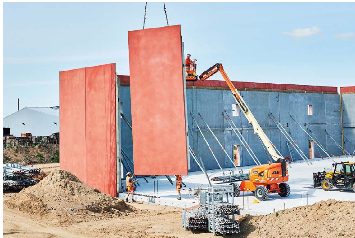
Opførelsen af Bevaringscenter Sønderjylland holdt fuld fart i 2020 og var begunstiget af godt vejr. Heller ikke corona påvirkede byggeriet. Her rejses de store, indfarvede betonelementer, der udgør ydervæggene i magasindelen.

Gennem hele 2020 har bevaringscentret været under opførelse, og ligesom i 2019 har der for en gruppe medarbejdere været et betydeligt tidsforbrug til dette projekt, som naturligvis har bestyrelsens og ledelsens stærke opmærksomhed. Der opstod kortvarigt bekymring for, om den byggeproces, som netop var påbegyndt, kunne blive negativt påvirket af corona-krisen, måske endog med standsning og efterfølgende forsinkelse af byggeriet til følge. Det er dog ikke sket, og entreprenøren BASE Erhverv er uførtrodt fortsat sammen med de mange underleverandører. Projektet forventes derfor fortsat klar til overtagelse 14. juni 2021, dog først med forventet indflytning fra efteråret, idet det skal