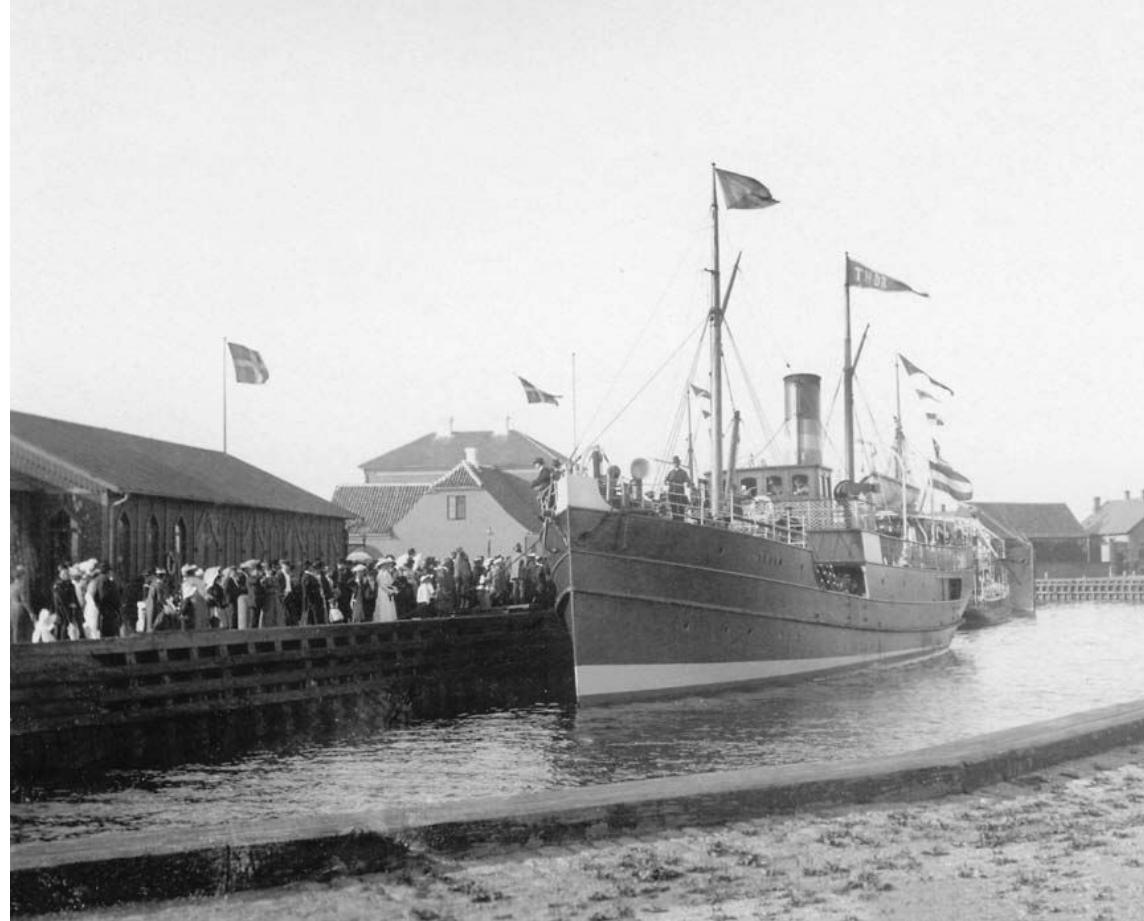
På initiativ af Sønderjydsk Forening for Fredericia og Omegn besøgte en delegation af sønderjyder Fredericia den 11. juli 1892. De ankom med dampskibet Thor fra Sønderborg, hvorefter de havde et fuldt program med rundtur til mindesmærker i byen samt frokost og senere festmiddag på byens restauranter.

Ifølge beskrivelsen i avisen var byen flagmættet, og delegationen blev fulgt af et stort antal mennesker rundt til byens mange mindesmærker. Fredericia havde i 1892 flere markante mindesmærker fra de slesvigske krige, hvor Fredericia spillede en central rolle i både 1849 og igen i 1864. Mindesmærkernes reference til krigene var en synlig påmindelse for fredericianerne om samhørigheden med delegationen, og sønderjydernes dansk-nationale tilhørsforhold blev understreget i avisen ved beskrivelsen af delegationens overlegne kendskab til de fælles fædrelandssange: "Opmærksomme fredericianere må sikkert have lagt mærke til, at sønderjyderne var bedre kendte med vores fædrelandssange end de danske; heroppe kan man som regel kun et, eller højst 2 vers; men sønderjyderne kunne både 3 og 4". 48