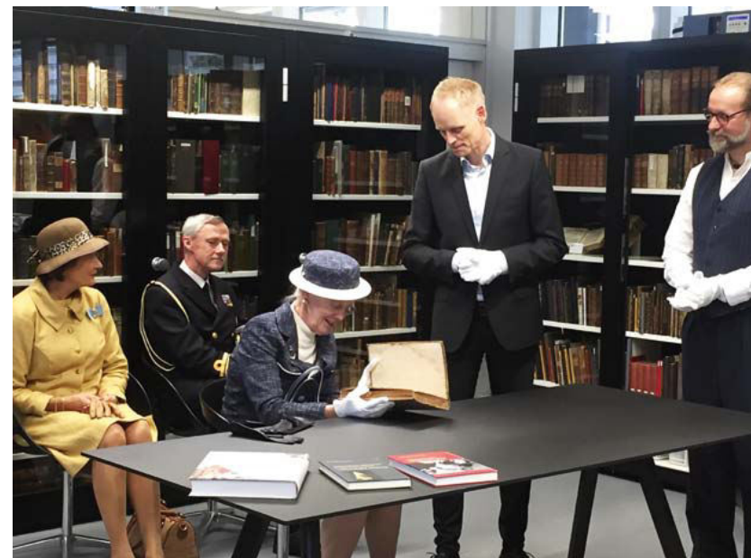
Den 6. september 2019 besøgte Dronning Margrethe Den Slesvigske Samling ved Dansk Centralbibliotek for Sydslesvig. Her fik hun en introduktion til samlingen og nogle af dens ældste bøger.

Årets største begivenhed var ubetinget dronning Margrethes besøg i Sydslesvig den 3.-6. september 2019. Det var dronningens første officielle besøg i delstaten Slesvig-Holsten og hos det danske mindretal siden 1978. Som en del af programmet besøgte hun Dansk Centralbibliotek i Flensborg, hvor hun blandt andet fik en introduktion til DSS og blev præsenteret for nogle af vores ældste bøger fra 1500-tallet.