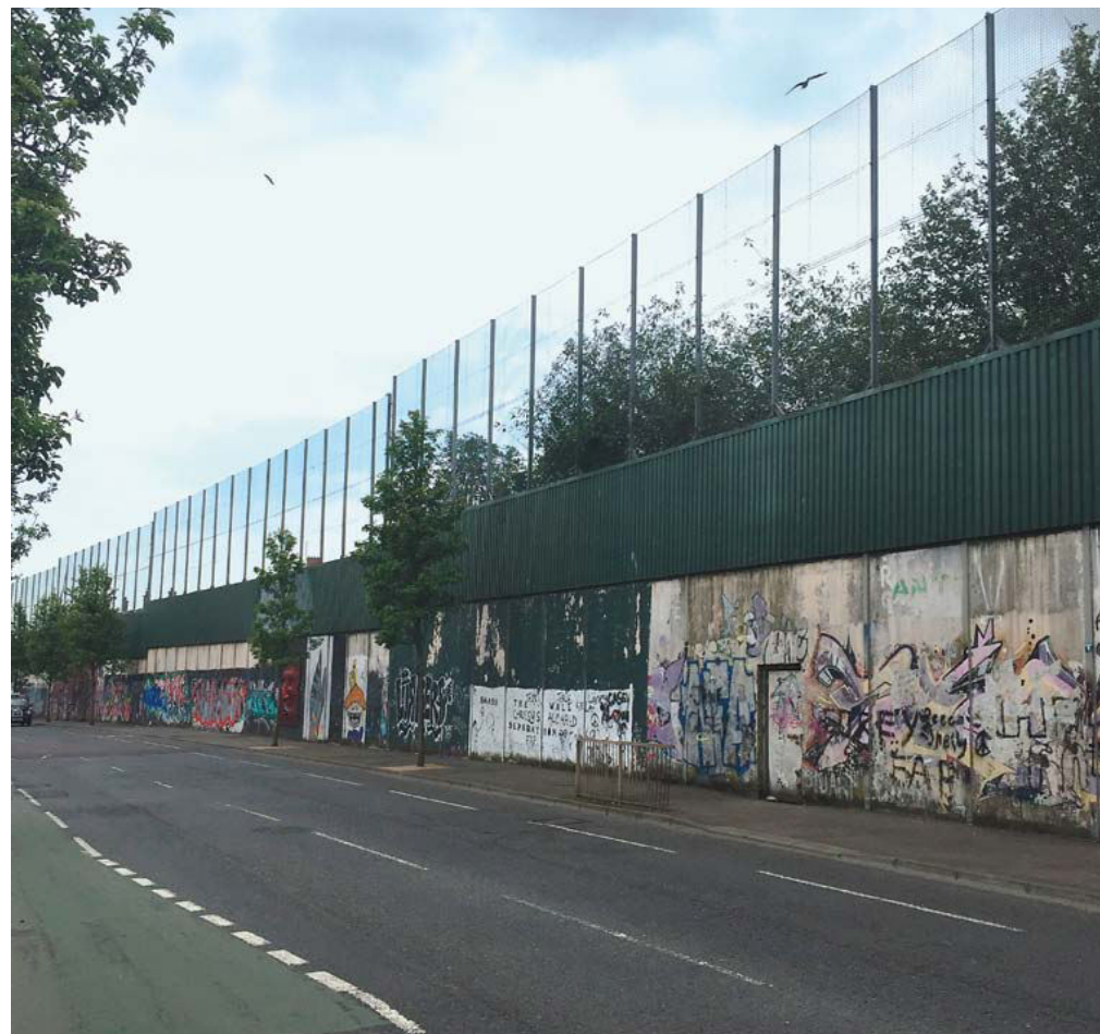
Mens grænsen mellem Nordirland og republikken i landskabet er næsten usynlig og vanskelig at finde, er der masser af grænser på den nordirske side. Her er det den såkaldte Peacewall, der deler protestantiske og katolske dele af Belfast.

- gerne med interviews og møder med lokale kendere - kunne blive et varemærke for vores omgang med europæiske grænseregioner. Erfaringen med at læse og forstå en anden grænseregion var vigtig, og det vil ses i nedslag i forskningen efterfølgende. Den irske grænse fylder i øvrigt også hundrede år i 2020 - og komparative aspekter kan ikke betones nok, når vi taler om grænser og problemstillinger på tværs af dem.