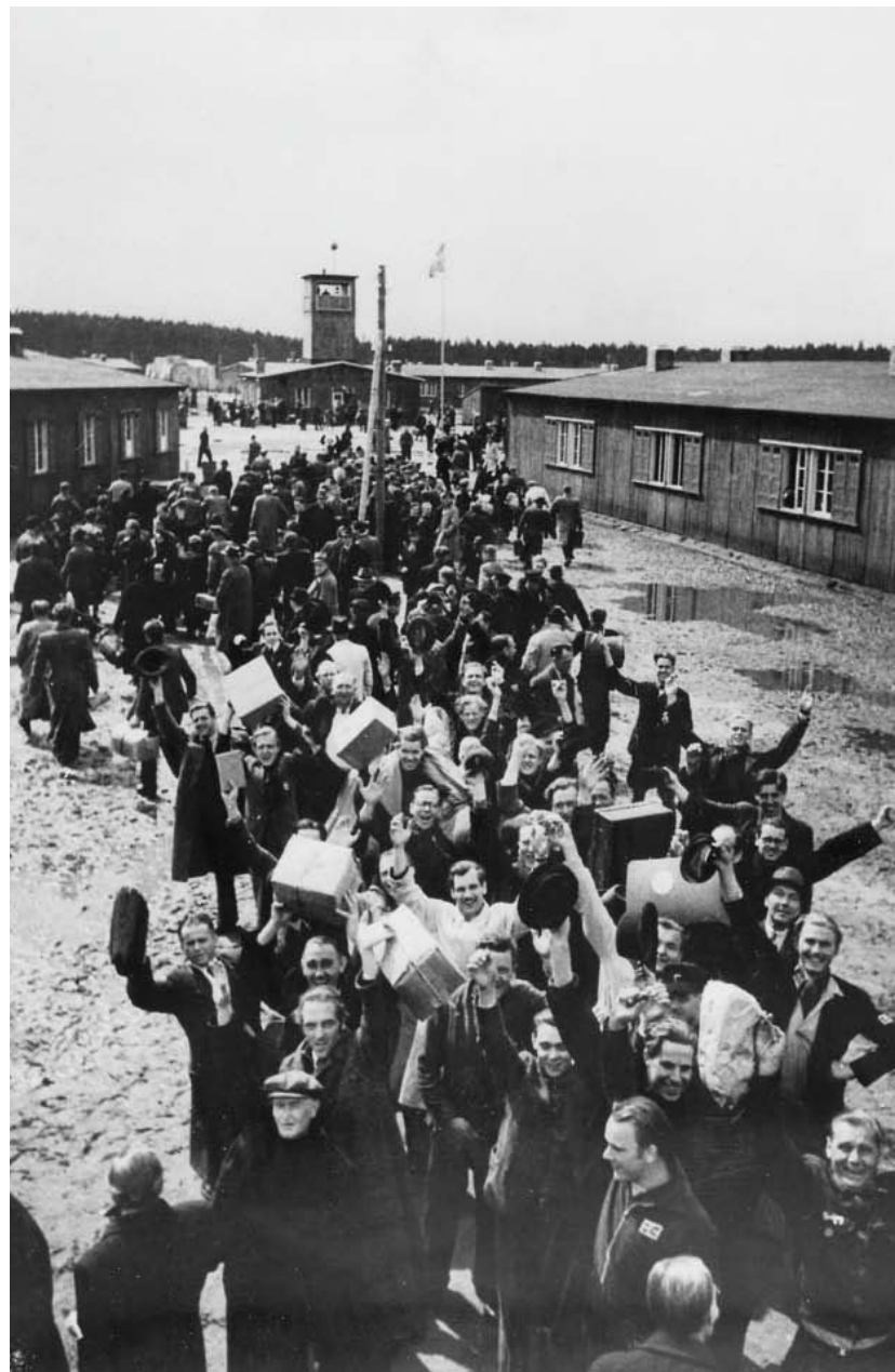
Befrielsesglæde i Frøslevlejren den 5. maj 1945. Bemærk pløret, som var et tilbagevendende problem i lejren.