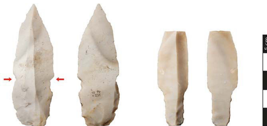
To skafttungespids, hver set fra to sider. Den højre er fremstillet af den dygtige flintsmed. Sådan skal den se ud, blot er selve spidsen knækket af. På spidsen til venstre har flintsmeden hjulpet lærlingen ved med to hak (udfor pilene) at markere, hvor skafttungespidsens skuldre skulle begynde. Lærlingen er begyndt, men teknikken med at presse og knuse flint i form fejlede, og stykket måtte kasseres.

Ved Nørremose i V. Nebel Sogn fandt arkæologerne to flintkoncentrationer fra Bromme-kulturen, ca. 11.800-10.500 f.Kr. Fund fra denne periode er i sig selv sjældne, og her fik vi endda et lille indblik i en jæger-samler familie og dens hverdag. Den meget vekslende kvalitet af flintbearbejdningen viser, at der i familien var en meget erfaren og dygtig flintsmed, en "lærling", der ikke helt havde styr på teknikken endnu, og endelig en absolut begynder, der har slået formålsløst på flintestenene, uden at de er gået i stykker. Det er nærliggende at slutte, at der er tale om et barn, der har leget flintsmed sammen med de voksne.