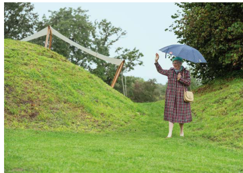
Dronningen i Danevirkes historiske portåbning Kalegat – i regnvej.

Danevirke Museum åbnede efter vinterpausen den 1. marts med en særudstilling i anledning af 100-året for folkeafstemningen om grænsen. Udstillingen 100 år senere... Mindretalsliv i Sydslesvig i dag præsenterer pressefotos af mindretallets medlemmer og aktiviteter fra de sidste år. Den bliver ledsaget af et udstillingskatalog på 24 sider af samme navn. Særudstillingen var oprindeligt annonceret til tidsrummet 1. marts til 17. april, men da mu-