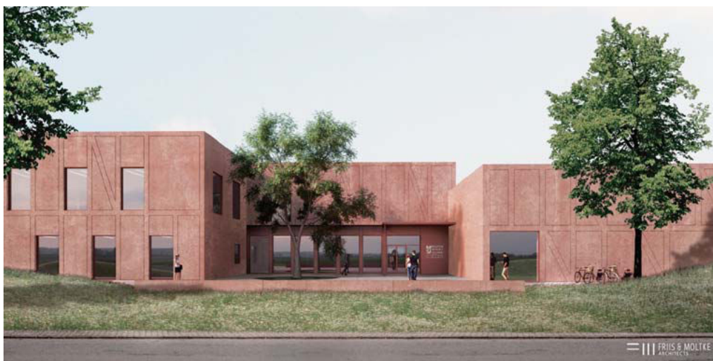
Visualisering af indgangspartiet til Museum Sønderjyllands nye, store bevarings- og læringscenter ved Rødekro, som rejser sig i 2020 og forventes indviet i efteråret 2021. Byggeriet opføres i en bemærkelsesværdig, flot rød indfarvet beton og skiller sig ud fra de typisk bortgemte museumsmagasiner. Illustration: Friis & Moltke Arkitekter.

Vinderprojektet er karakteristisk ved at rumme et stort, centralt rum midt i bygningskomplekset, med funktionerne placeret omkring dette og