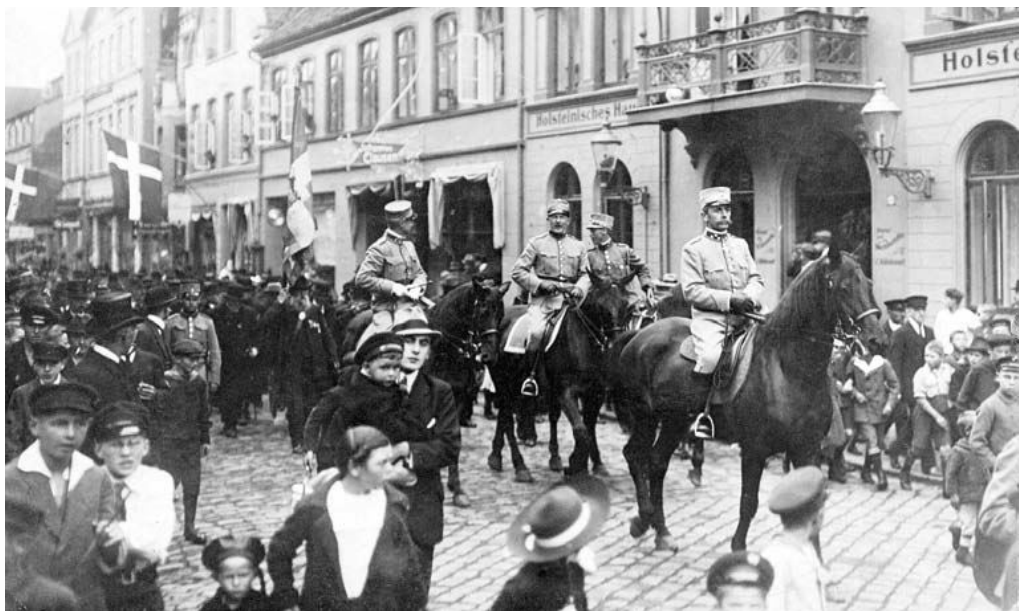
Oberst Carl Moltke til hest forrest under indtoget i Sønderborg den 5. maj 1920.

Musikkorps, I. Bataljon med chefen, Oberst Carl Moltke, og kommandoets stab blev om morgenen den 5. maj udskibet fra Assens ombord