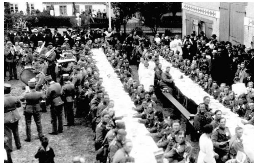
Sønderjysk kaffebord og regimentsmusik – Sønderjysk Kommandos besøg på Kegnæs i maj 1920.