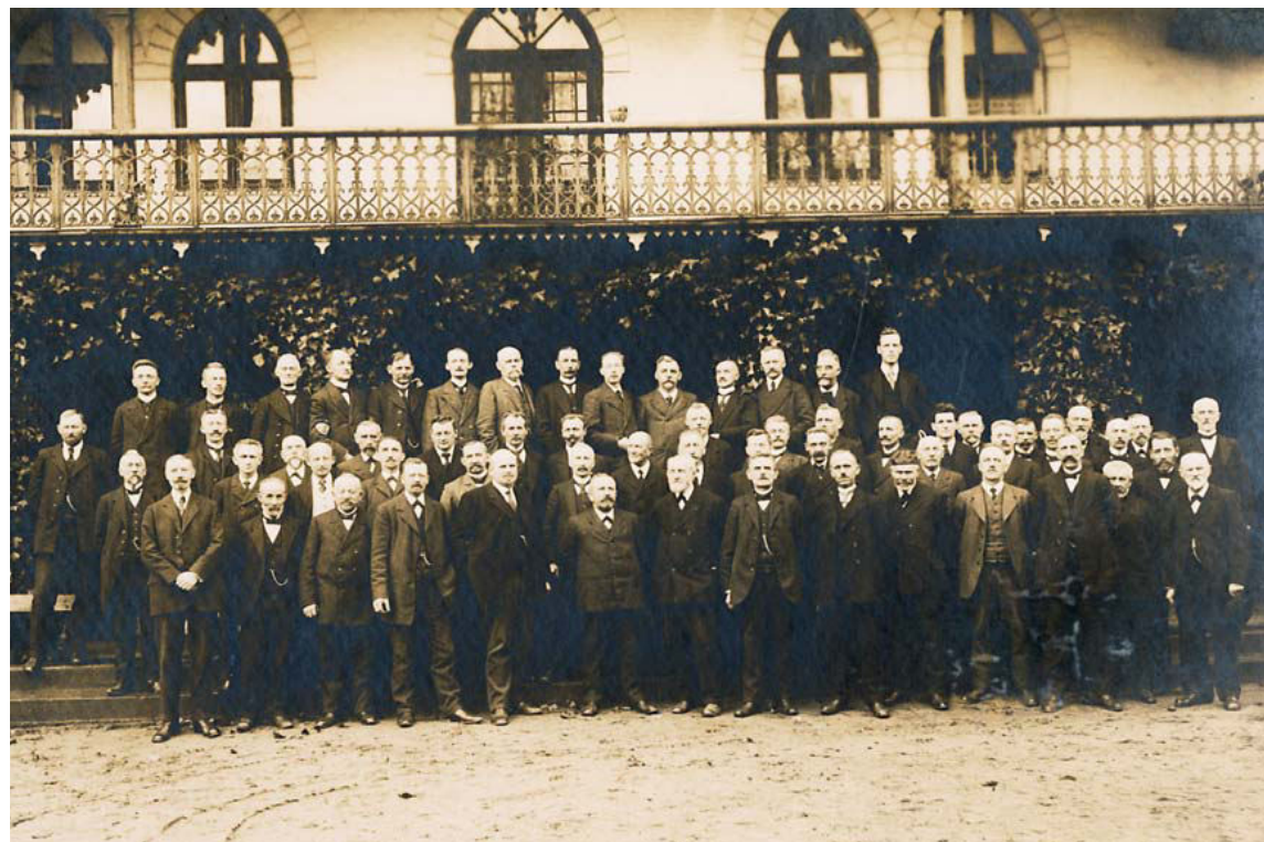
Vælgerforeningens bestyrelse og tilsynsråd i 1918 foran Folkehjem i Aabenraa. Tilsynsrådet var direkte valgt af medlemmerne og kunne derfor udtale sig med vægt på foreningens - og dermed på de danske sønderjyders - vegne.