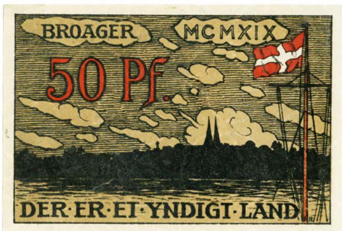
Nødpengeseddel fra Broager, udstedt december 1919.

I starten af afstemningskampen var afstemningsområderne fortsat underlagt de tyske myndigheder. Det kunne derfor stadig være en udfordring at lave sedler med dansksindede motiver. Det måtte Broager kommune sande efter, at de den 8. december 1919 havde sat en seddel i omløb med et motiv, hvor man i skumringstiden kigger ind fra havet mod Broager Kirke. I højre hjørne ses en mast på et skib, hvor Dannebrog er hejst. Nederst på sedlen står titlen på den danske nationalsang, "Der er et yndigt land". Denne seddel, der blev trykt i et oplag på 51.000, blev kort efter forbudt med henvisning til, at teksten var på dansk samt, at Dannebrog var hejst i et område, der stadig var tysk. 9 Det betød dog ikke at nødpenge med danske motiver forsvandt og både i Sønderborg, Dynt og Broager udstedtes der plebiscitpenge allerede i 1919, som advokerede for den danske sag. 10