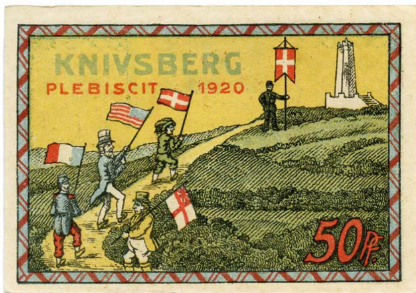
Nødpengeseddel fra Knivsbjerg, udstedt 1920.

Det var også Appel, der stod bag en af de mest notoriske falske sedler i Nordslesvig, nemlig denne seddel underskrevet af byrådet i Knivsbjerg. Problemet er imidlertid, at der aldrig har været en kommune i Knivsbjerg. Knivsbjerg er et højedrag i Sønderjylland, som har fungeret som et samlingssted for den tysksindede befolkning. Her indviedes i sommeren 1901 et 45 meter højt tårn med en statue af Otto