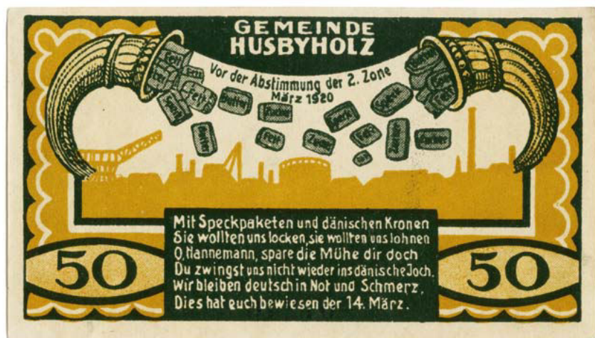
Nødpengeseddel fra Husbyskov, udstedt juli 1921.

Særligt på halvøen Angel blev der trykt en stor mængde af de såkaldte "Erinnerungsscheine" til minde om sejren i zone 2. Et eksempel er denne seddel udgivet i juli 1921 i Husbyskov, der viser to overflødighedshorn, der hælder levnedsmiddelpakker med smør, fedt, sukker og flæsk ud over zone 2 op til afstemningen i 1920. Pakkerne er en hentydning til de danske nødhjælpspakker, som blev givet til dansksindede i Slesvig efter 1. verdenskrig. Det blev i tyske kredse opfattet som et forsøg på at købe danske stemmer og dem, der tog imod hjælpepakkerne, blev af tyskerne nedladende betegnet som "Speckdänen" (flæskedanskere). Teksten hylder viljen til at forblive tysk i "nød og smerte" trods de danske forsøg på at "tillokke" sig stemmer med levnedsmid-