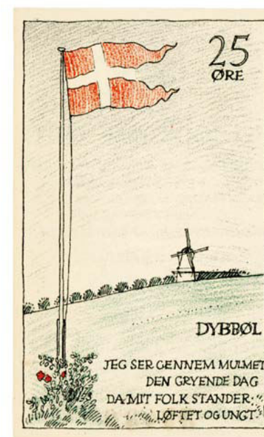
Nødpengeseddel fra Dybbøl, udstedt april 1920.

udgivet efter folkeafstemningerne sig generelt i to kategorier – dem der hyldede og dem der udtrykte utilfredshed med resultatet af afstemningerne. Resultatet af afstemningerne i zone 1 (Nordslesvig) og 2 (Mellemslesvig) var klart. Den 10. februar 1920 havde ca. 75 % af de stemmeberettigede i zone 1 stemt for at Nordslesvig skulle være dansk, mens ca. 80 % af de stemmeberettigede i zone 2 den 14. marts havde stemt for, at Mellemslesvig skulle forblive tysk. Både på dansk og tysk side blev der efterfølgende udsendt en del sedler, som fejrede sejren i henholdsvis zone 1 og 2. Fra dansk side var der stor glæde og fokus på, at Nordslesvig nu blev en del af Danmark, hvilket blev understregget med udsagn som "atter det skilte bøjer sig sammen" og "ved genforeningen med Danmark sker folkets ret fyldest". I nogle tilfælde var budskabet mere spottende overfor tyskerne med formuleringer som "ørn nu må du fly, dansk vi blir påny" og "med vold de ville verden vinde, de styrtes fra magtens tinde". 16 I Dybbøl udgav man i april 1920 sedler på 25 og 50 øre, blandt andet den her viste med Dybbøl Mølle i baggrunden. Den danske krone blev imidlertid først indført i Nordslesvig i slutningen af maj måned. Sedlerne blev derfor forbudt allerede efter to dage og betragtes mest af alt, som en dansksindet manifestation af sejren i zone 1. 17