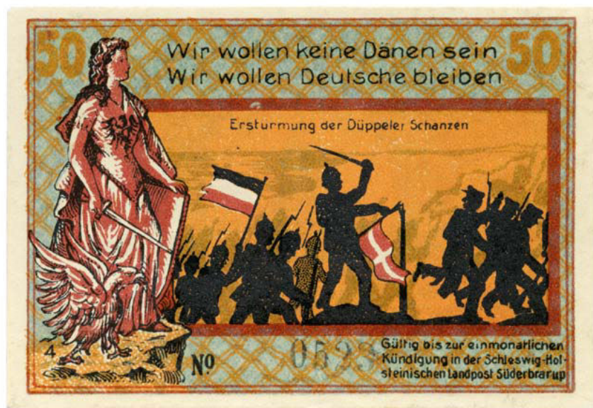
Nødpengeseddel fra Sønder Brarup, udstedt 1921.

Utilfredsheden kom dog mest til udtryk på tyske plebiscitpenge, hvor vreden over tabet af Nordslesvig blev illustreret på en række stærkt nationalistiske sedler. Det gik eksempelvis ud over et af danskernes vigtigste nationalsymboler, Dannebrog. På mange sedler ser man enten flaget blive revet itu, trampet på eller hængende langs jorden på knækkede flagstænger. På nogle sedler betegnes Nordslesvig desuden som "Neu-Dänemark" for at understrege, at Danmark uretmæssigt havde indlemmet et stykke af Slesvig, som ifølge tyskerne aldrig havde været dansk. Historiske begivenheder, der fremhævede tyske sejre over danskerne, vigtige personer og begivenheder i Slesvig-Holstens kamp for selvstændighed fra den danske helstat i midten af 1800-tallet og tysksindede mindesmærker i Nordslesvig var også populære motiver i årene efter folkeafstemningerne. På enkelte sedler udtrykkes ligefrem håbet om, at en ny generation vil revanchere sig og vinde det tabte land tilbage. 21 Særligt i Sønder Brarup kommune blev der udgivet mange