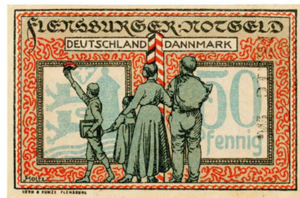
Nødpengeseddel fra Flensborg, udstedt januar 1920.

Holtz' seddel var oprindelige planlagt til at blive udstedt den 1. august 1919. Oplaget nåede endda at blive trykt med denne dato, hvilket fremgår af sedlens bagside, hvor datoen 1. august 1919 er streget ud. Imidlertid valgte man i sidste øjeblik at skyde udstedelsen. I stedet blev den