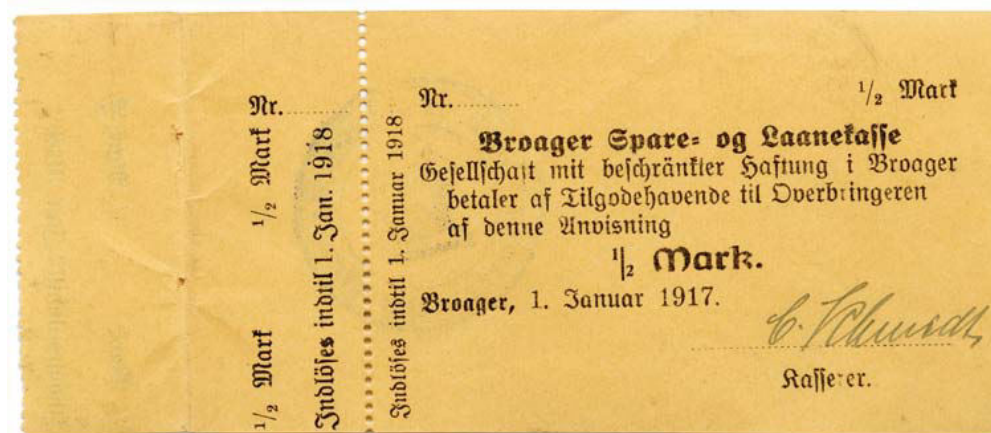
Nødpengeseddel fra Broager Spare- og Laanekasse, udstedt januar 1917.

Det var dog kun den spæde start på de nationalt prægede nødpengesedler. Godt en måned før afslutningen af 1. Verdenskrig besluttede den tyske regering d. 9. oktober 1918, at bede amter og kommuner om hjælp til at trykke pengesedler med større værdier på mellem 5 og 100 mark. Det betød at nødpenge snarere blev normen end en nødforanstaltning.