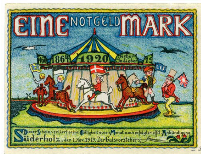
Nødpengeseddel fra Sønderskov, udstedt november 1919.

senterer Ribebrevet fra 1460 og ideen om, at Slesvig og Holsten for evigt skulle være udelt – "up ewig ungedeelt". På den anden hest sidder en dreng med prøjsisk fane, som illustration på krigen i 1864 og den preussiske erobring af Slesvig. På den tredje hest vifter drengen med et Dannebrog. Han sidder under årstallet for folkeafstemningerne i 1920 og viser danskernes ønske for den kommende grænsedragning. Den fjerde hest er ledig. Karruselmanden byder John Bull, som er en karikereret udgave af briterne, ombord på karrusellen, og det helst jo før jo bedre ("Je eher, je lieber"). I hånden holder Karruselmanden en fane med bogstaverne CIS (forkortelse for Commission Internationale de Surveillance du Plebiscite Slesvig) og slet skjult på indersiden af bukserne, har han et Dannebrog. Han repræsenterer Den Internationale Kommission, som overtog forvaltningen af afstemningsområderne fra de tyske myndigheder i januar 1920 og skulle sikre frie, uhindrede og hemmelige afstemninger. CIS var imidlertid nedsat af de sejrende magter i 1. Verdenskrig og blev fra tysk side anset for at favorisere danskerne og dermed ikke som en uafhængig kommission. Der er derfor tale om en satirisk fremstilling af de kommende afstemninger, som viser, at tyskerne ikke følte sig fair behandlet. Ved at byde John Bull ombord på karrusellen får danskerne en hjælpende hånd frem mod de kommende afstemninger, som derfor ikke fremstår som retfærdige og demokratiske. 8