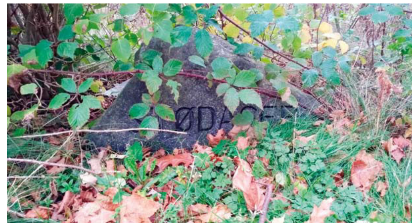
Gården Stødager er væk i dag, men dele af haven står endnu – ligesom navnestenen ved den tidligere indkørsel til gårdspladsen – omgivet af erhvervsbyggeri.