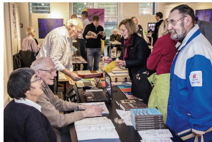
Fra Historiske Dage 2019.

Vanen tro deltog FA og DSS på en fælles sønderjysk stand ved de Historiske Dage i København i marts måned 2019. I årets udgave af Historiske Dage havde vi valgt at fokusere på "æ sproch" og vise grænselandets sproglige særpræg på sønderjysk, frisisk og plattysk. På vores stand var der rig lejlighed til at deltage i konkurrencer, få smagsprøver, se filmklip og andet godt, som illustrerede de forskellige sprog og dialekter. Derudover var der gode tilbud på bøger om sønderjysk og slesvigske historie samt mu-