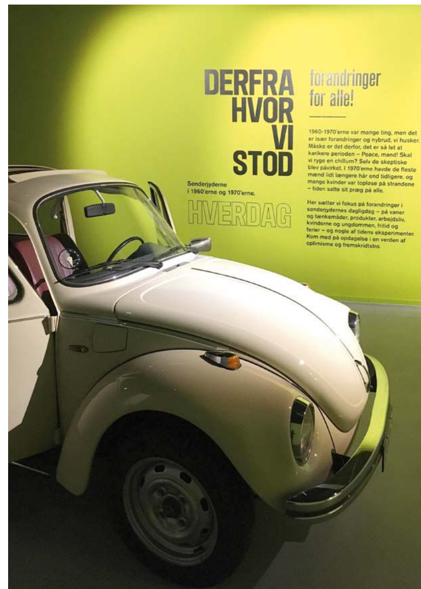
Med særudstillingen "Derfra hvor vi stod" har museet sat fokus på en vigtig del af nyere tids danmarkshistorie, som mange stadig kan huske og var en del af. Udstillingen blev opbygget med inddragelse af sønderjyder, der selv havde oplevet den tid, og som blandt andet har udlånt vigtige genstande til museet og bidraget med levende, personlige erindringer om, hvordan de oplevede 1960'erne og 1970'erne.

Udstillingen var skabt af en lille gruppe strikkere fra Trekantområdet. Kulturarven er levende og kan være en rig kilde til inspiration og fornyelse. Gruppen går gerne i gemmerne på kulturhistoriske museer for at finde inspiration til, hvordan man kan omsætte den tekstile kulturarv til nyt og dermed sætte fokus på de gamle tings og teknikkers kvaliteter. Her var inspirationen de supertynde kniplinger fra begyndelsen af 1800-tallet, og ét håndværk – kniplingen – inspirerede til et andet, strikningen, som blev anvendt til fremstilling af både dragttekstiler og boligtekstiler i smukke mønstre.