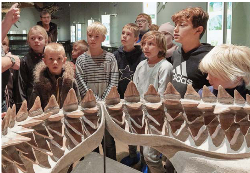
Gram Lergrav, hvor der fortsat gøres vigtige fund med bistand fra publikum, rummer med kombinationen af museum og aktiviteter i lergravene et stort potentiale for formidling af naturhistorie til børn og unge.

som tilsyneladende har været nedgravet i et stort vikingehus. Det tyder på, at skatten har tilhørt en stormand, som har gemt sin opsparing af vejen. Mønterne er præget så langt væk som i Mellemøsten og Frankeriget, der dækkede det nuværende Italien, Frankrig og Tyskland.