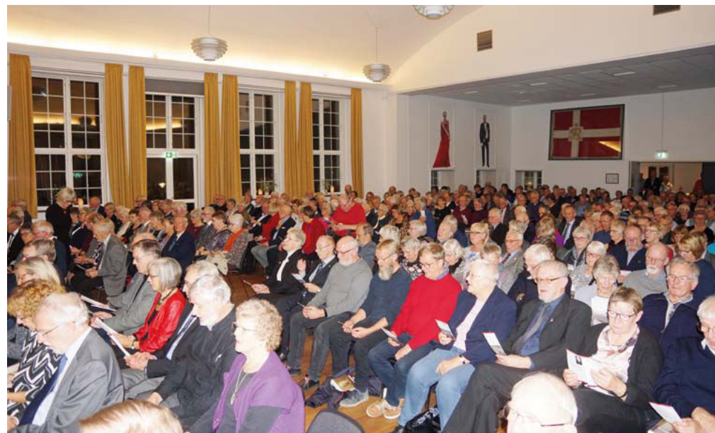
Historisk Samfunds og Sprogforeningens store arrangement på Folkehjem den 17. november 2018 blev noget af et tilløbsstykke. På billedet ses et udsnit af de 395 deltagere.