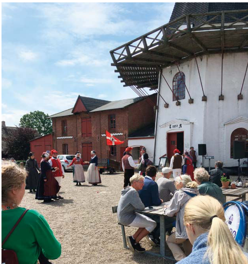
Højer Mølle ser en ny, lovende fremtid i møde med nye udstillinger om Tøndermarskens særlige kulturlandskab samt en ny cafe, der skaber langt bedre forhold for publikum.

Højer Mølle lukkede for publikum medio 2018, da omdannelsen til den kulturhistoriske port til Vadehavet blev påbegyndt. Projektet er en del af Tøndermarsk-initiativet, der støttes af en række store fonde som Realdania, A.P. Møller-fonden og Nordea-Fonden. Gennem 2018 og frem til efteråret 2019 gennemgår Højer Mølles to magasinbygninger, Store Spiker og Lille Spiker, en gennemgribende restaurering og indrettes med nye, indbydende og engagerende udstillinger, der fokuserer på det særlige kulturlandskab, som marsken og dens byer er udtryk for. I sammenhæng med dette projekt gennemfører Museum Sønderjylland en omfattende ombygning og om-