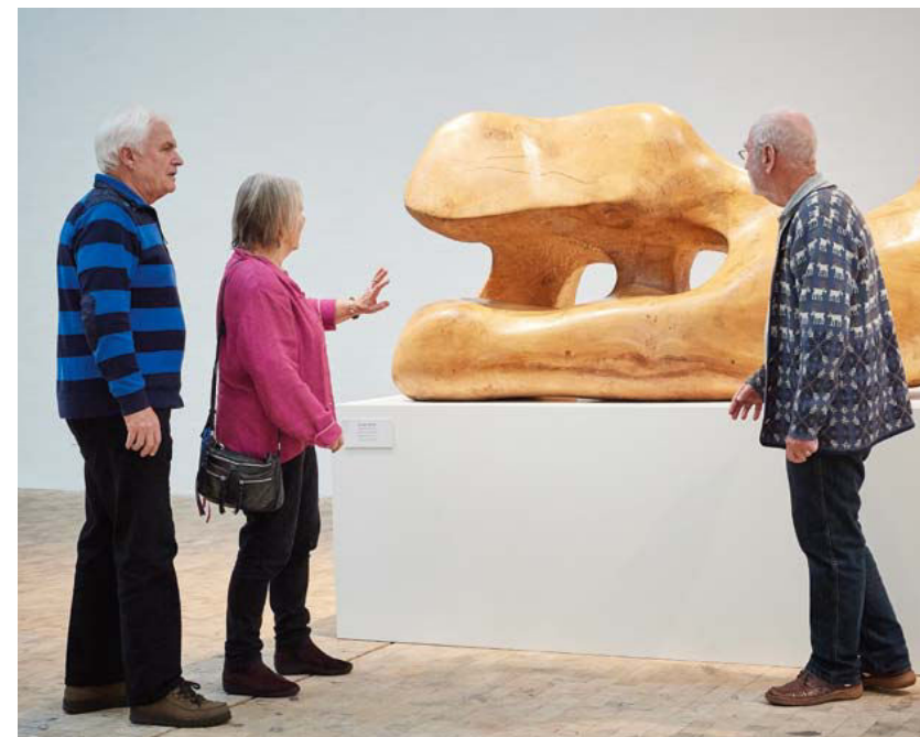
Museerne i Tønder består af kunstmuseet og det kulturhistoriske museum, der begge har hjemme i et museumskompleks, som kan måle sig med de bedste i landet og i sig selv er et besøg værd. Henry Moore-udstillingen viste, at større og ambitiøse særudstillinger kan påvirke besøgstallet positivt.

Museets to fyrtårne, Sønderborg Slot og Museerne i Tønder, udviste trods den varmeste sommer til dato målt i Danmark udmærkede besøgstal omkring det normale niveau. I 2018 var der ikke som i 2017 en landsdækkende spejderlejr med flere tusinde gæster, hvorfor et besøgstal på 53.148 mod 56.322 er ganske udmærket, ikke mindst sommeren taget i betragtning; det vil sige et fald på 6 %, hvilket må betragtes som normaludsving.