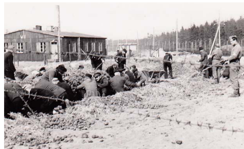
Internerede i Fårhuslejren graver i lejrens kartoffelkule. De interneredes arbejde bestod primært i at opretholde lejrens drift, ligesom det havde været tilfældet med Frøslevlejren.

Museet har ved flere lejligheder i 2018 betjent både de skrevne og de elektroniske medier i forbindelse med formidlingen af Anden Verdenskrig