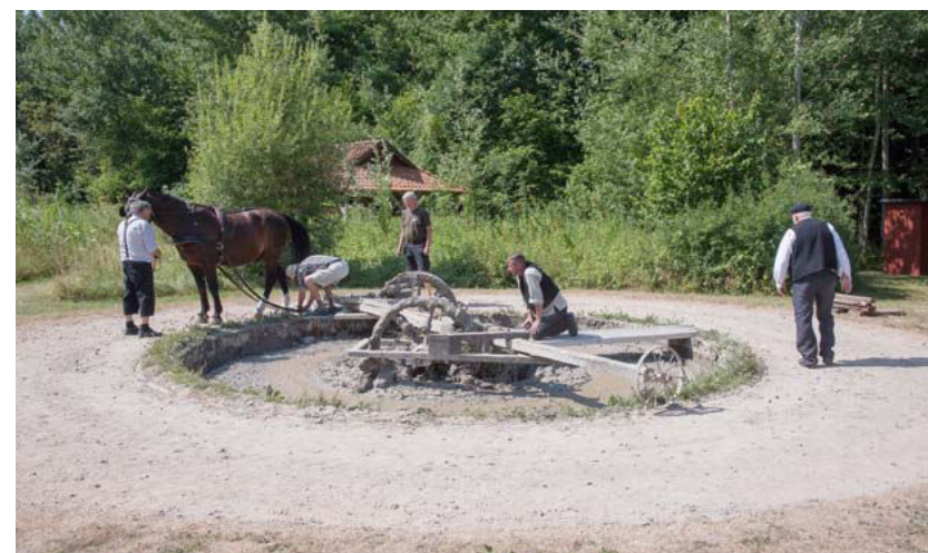
Cathrinesmindes enestående velbevarede kulturmiljø danner rammen om styrkede formidlingsaktiviteter hen over sommeren med både levendegørelse af arbejdet og livet knyttet til teglværket og med den fire dage lange festival Levende Teglværk, hvor hele teglværket er bemannet og summer af liv.

Endelig har afdelingen arbejdet med modeller for projektstyring og budgetlægning, som skal implementeres på tværs af museet ved udstillinger og større aktiviteter. Årsplanlægningen søges i 2019 rykket frem, således at der tidligere på året foreligger en plan for udstillinger og aktiviteter i det følgende år.