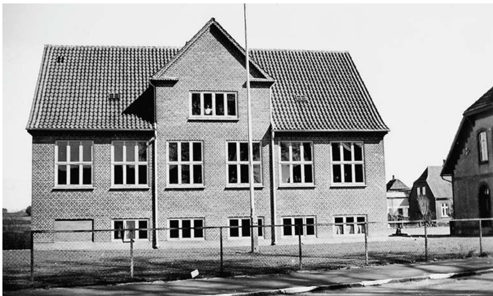
Den toklassede Aadsbøl Skole i Aabenraa Amt havde i 1940 fået egen gymnastiksal, sløjdlokale og skolekøkken, men de sanitære forhold i lærerboligerne var så ringe, at førstelæreren ønskede en anden stilling. Lærerinden fik først ordentlige boligforhold, da hun i 1962 fik anvist indkvartering i en nyopført andelsbolig i Gråsten by.