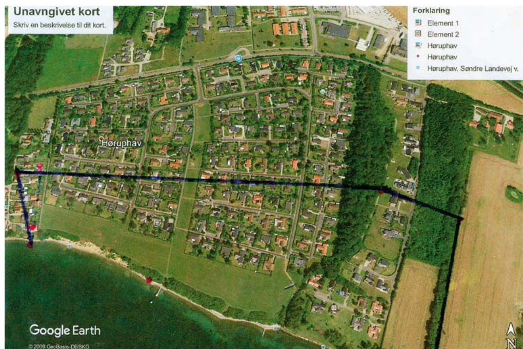
Østligste del af Høruphav med markering af den omtrentlige afgrænsning af lejrens ydre grænser. Billedbaggrunden fra Google Earth.

Man skal tage i betragtning, at der ikke på noget tidspunkt var så mange mennesker i lejren, som den var bygget til. Det har utvivlsomt været med til at gøre forholdene for flygtningene i Hørup bedre end i andre lejre i Danmark, hvor forholdene var dårligere. Det har formentlig også været en væsentlig grund til, at dødeligheden, især for spædbørn, i lejren var forholdsvis lav.