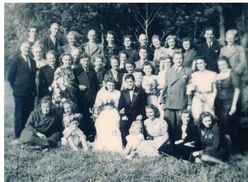
Bryllupsselskabet i lejren, august 1947.

tilfaldt sundhedspersonalet som f. eks. udgangstilladelser, der blev udnyttet til cykelture til Sønderborg, hvor bekendte fra opholdet her forsynede hende med cigaretter, kaffe og andre forbrugsgoder. Hun passerede ved hjemkomsten uhindret lejrvagten, der vendte det blinde øje til. I.-L. husker tydeligt tyfusedpidemien i efteråret 1945, f.eks. når vagtmandskabet blev kaldt til en plaget patient, der dog ofte modtog dem med et "Schon zu spät" – tarmen havde tømt sig. Efter nattevagterne stod der hver morgen frisk kaffe, rundstykke og cigaretter til vagtholdet. Moderen arbejdede som skrædder og syerske i et lokale i deres barak. Hun var opfindsom, syede således en kasseret hvid natkjole om til en smuk brudekjole til et bryllup i august 1947. Også lejrens teater- og dansegrupper udstyrede hun med flotte dragter. Der blev arrangeret baller i teatersalen, men kl. 22 blev alt lys slukket og de deltagende måtte finde hjem. Hvis nogen herefter befandt sig i terrænet, blev de afsløret af en lyskasters vandrende lyskegle. Under lejropholdet udviklede I.-L. et tæt forhold til én af de patruljerende CB-vagter. Efter at være blevet repatrieret i september 1947, hvor lejren stort set var tømt, tog hun og moderen ophold hos familie i Østberlin, og senere i Flensburg. Herfra hentede