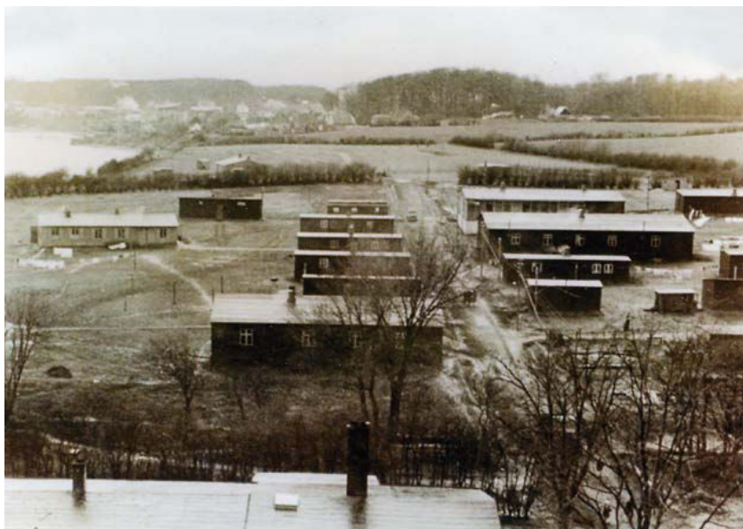
Fotos fra lejren. Første billede viser den øst-vest gående "hovedgade" mod øst med vandtårnet ragende op. Det andet billede ser mod vest og er fotograferet fra vandtårnet med lidt af Hørup Hav og længere bagude huse i Høruphav samt Præsteskoven.

affald, men det synes ikke at have tilstrækkelig effekt i det lange løb, for i januar 1947 "kniber det stadig med at færdes ude i lejren, når der er tøj". 61