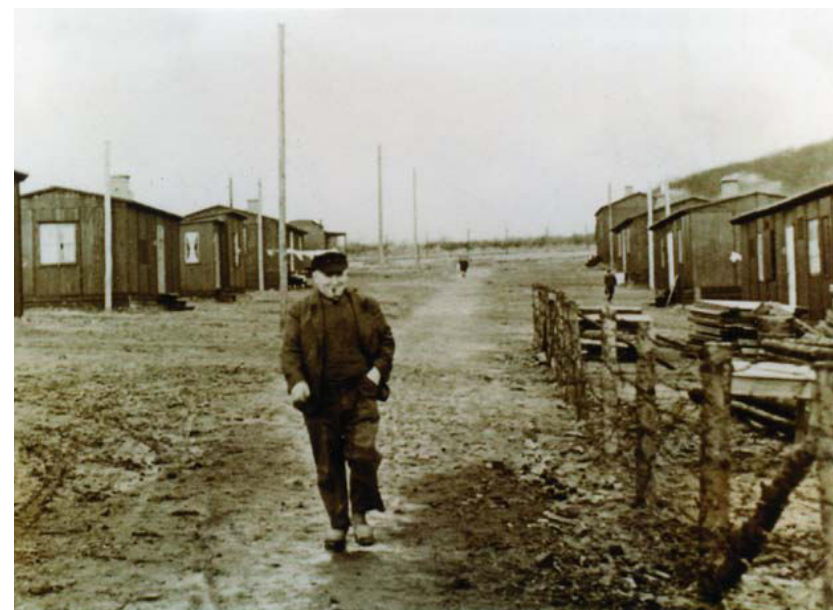
Fotos fra lejren. Første billede viser en af de store barakker med indgang midt på langsiden, og på det andet billede fås et indtryk af den triste lejrhovedgade og det smattede terræn.