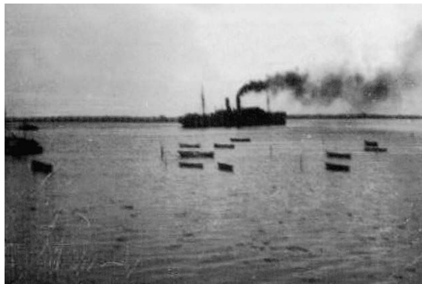
Til venstre ses MS "Oceana" som "Kraft-durch-Freude"-turistskib (fra Schön, H.2000). Ovenfor ses skibet sejle fra Hørup Hav d. 8. maj 1945.

Efter kapitulationen den 5. maj var lejren, efter at minespæringerne var fjernet, klar til at modtage flygtninge. 29 Der var i alt 470 flygtninge den 11. juni 1945, som var blevet indkvarteret her, heraf 179 børn. 30 For