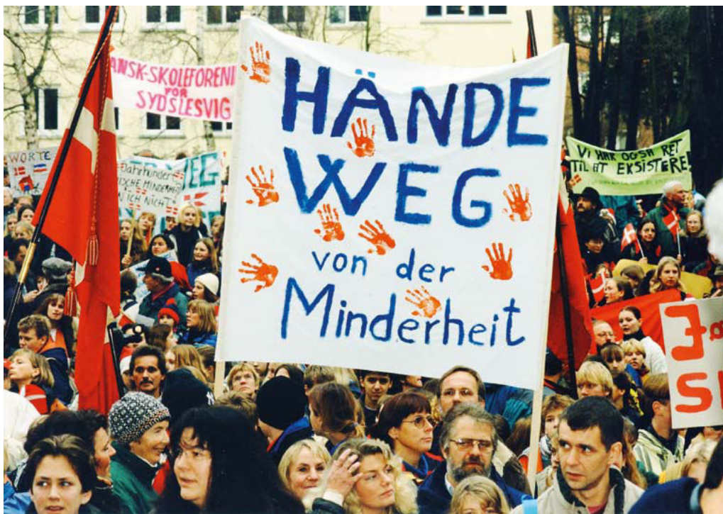
Et eksempel på SSF's politiske virke. I 1997 blev der organiseret omfattende demonstrationer mod de af landsregeringens spareplaner, der særligt var rettet mod det danske mindretal.

SSW opfatter sig selv som et mindretalsparti, også for friserne, og anslår, at over 90 procent af medlemmerne også er medlemmer af andre mindretalsforeninger. 64 For at kunne konkurrere med andre partier på den politiske scene lægger SSW's repræsentanter vægt på deres behov for at være fritaget fra fem procents spærreglen. En ligeværdig konkurrence ville ikke være mulig uden denne fritagelse. Kun når SSW er en del af det regulære politiske spil, kan det udtrykke sin politik, hvilket er af betydning for både mindretallet såvel som flertallet af befolkningen. SSW blev i 2012 endnu mere politisk involveret, idet partiet blev en del af Slesvig-Holstens regering, et mål det havde stræbt efter.