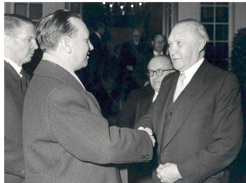
Et efterhånden ikonisk billede fra indgåelsen af København-Bonn-erklæringerne i 1955. Den danske statsminister H. C. Hansen hilser på forbundskansler Konrad Adenauer i Bonn den 29. marts.

Andre betydningsfulde mindretalsforeninger i regionen er i Danmark Deutscher Jugendverband für Nordschleswig og i Tyskland Sydslesvigs danske Ungdomsforeninger. Sideløbende med disse ungdomsforeninger findes der mange andre aktører, der organiserer forskellige fælles aktiviteter i Danmark såvel som i Tyskland. Det drejer sig for eksem-