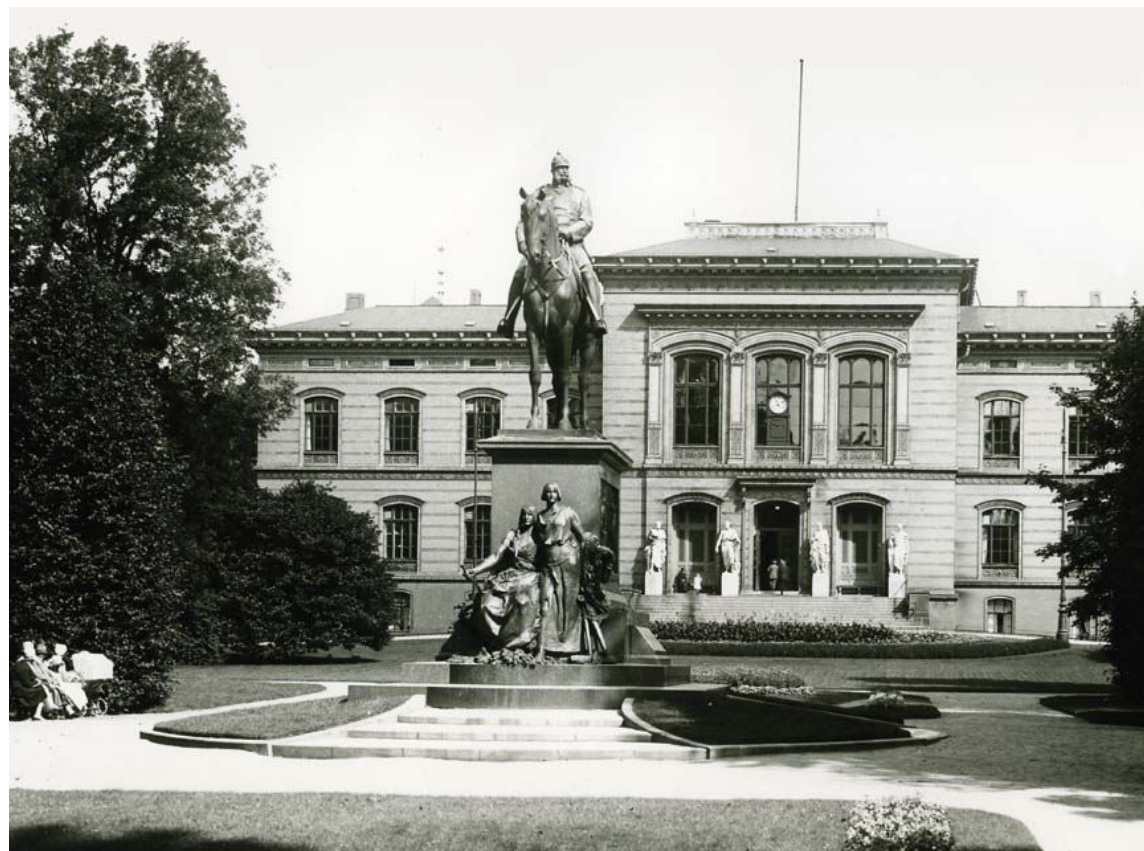
Hovedbygningen til Kiel Universitet, omkring 1925.

både undervisere og studerende af, at Christian-Albrechts-Universität (CAU) profilerede sig som "grænselandsuniversitet og som universitet, der rettede sig mod Norden", ligesom universitetet i sin egen selvforståelse skulle være førende inden for grænselandsarbejdet. 14