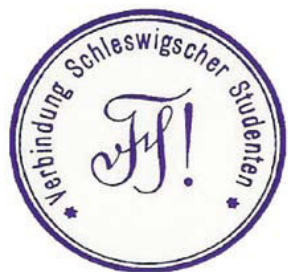
Verbindung Schleswiger Studentens segl.

af Slesvigske Studenter. 15 Sammenslutningen bestod blandt andet af studerende, der var indskrevet på et tysk universitet, men den kom primært til at danne en fast ramme for de tysksindede nordslesvigere, som læste i København for at opnå en dansk kandidatgrad. Kun med en dansk universitetsgrad måtte de udføre akademisk arbejde i deres hjemstavn, Nordslesvig. I tiden med de grænsepolitiske diskussioner i midten af 1920'erne kan grundlæggelsen af sammenslutningen samtidig opfattes som bevidst afgrænsning i forhold til de dansksindede sønderjyder, der havde sluttet sig sammen i den Sønderjyske Studenterforening. 16 Dette tydeliggøres også ved, at foreningen bevidst valgte at benytte betegnelsen "slesvigske studenter", hvorved de kunne identificere sig som tysksindede nordslesvigere. Formålet med foreningen formulerede den daværende "spiritus rector" – "den ledende ånd" – for foretagendet, Otto Meyer, således: