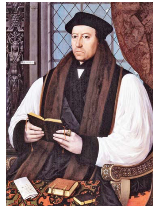
Thomas Cranmer (1489-1556) var ærkebiskop og Oldendorphs overordnede under hans ophold i England. Malet af Gerlach Flicke i 1545.

Johannes Oldendorph fik en anbefaling, men set i bagklogskabens lys skulle han ikke have taget imod den, da det senere kom frem, at Laski og Cranmer var velvilligt indstillet over for den zwinglianske reformati-