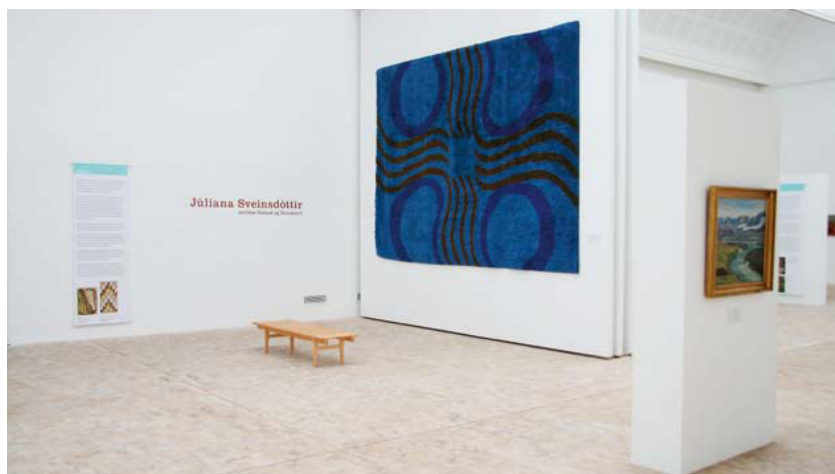
Fra udstillingen "Júlíana Sveinsdóttir mellem Island og Danmark" på Kunstmuseet i Tønder september 2016 – januar 2017. Midt i billedet ses Sveinsdóttirs største rya arbejde fra 1961-62, 300x400 cm, der til dagligt hænger i Højesteret i København.

Ny Carlsbergfondet har siden den store ombygning af Kunstmuseet i Tønder i 1999 betænkt kunstmuseet med mange vigtige kunstværker af nordiske og tyske kunstnere. Museets nordiske profil og dets beliggenhed ved den dansk/tyske grænse har fondets bevågenhed. I 2016 skænkede fondet tre malerier af den svenske billedkunstner Evert Lundquist (1904-1994). Kunstmuseet i Tønders museale ansvarsområde er væsentlige strømninger i det 20. og 21. århundredes nordeuropæiske kunst. En af disse strømninger er den særlige ekspressive billedkunst, man kender fra blandt andet Edvard Munch, Carl Frederik Hill, Emil Nolde, Asger Jorn, Per Kirkeby og Georg Baselitz. Af de sidstnævnte tre har Ny Carlsbergfondet tidligere skænket værker til kunstmuseet, og i 2016 fulgte tre