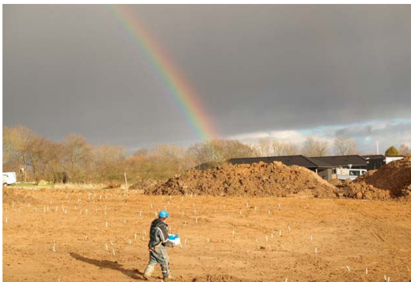
For enden af regnbuen? Et udsnit af den store bebyggelse ved Viggo Carstensensvej uden for Haderslev. Bebyggelsen stammer fra yngre romersk og ældre germansk jernalder, tiden mellem 300 og 500 e.Kr.

Afdelingen har i 2016 afgivet 317 høringssvar til lokalplaner, byggeansøgninger og mange andre typer af sager, der involverer anlægsarbejde under overfladeniveau. Det samlede antal af sager, der har været vurderet i løbet af året er stadig svagt stigende i forhold til årene under krisen. Det er langt over 6000 sager, der passerer museet årligt med henblik på at vurdere, om jordfaste fortidsminder kan blive ødelagt ved anlægsarbejder.