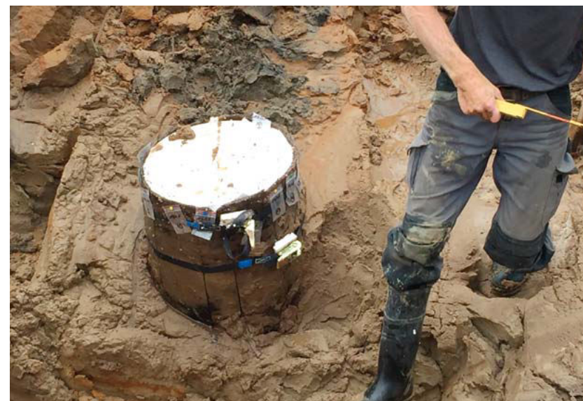
I den fugtige undergrund sydøst for Starup Kirke dukkede en velbevaret brønd op. Brøndkassen er en bødkret tønde, der er fremstillet i Lübeck eller deromkring i tiden 1235-1250.

Afdelingen varetager på vegne af Slots- og Kulturstyrelsen tilsynet med fredede fortidsminder og beskyttede sten- og jorddiger i de fire sønderjyske kommuner og Kolding Kommune. Således også i 2016, hvor omfanget af tilsynet og dermed det tilknyttede tilskud til opgavens løsning fra styrelsen atter blev mindre. Afdelingen er fortsat, på trods af den forringede økonomi, positivt indstillet over for at varetage arbejdet. I 2016 afsluttedes gennemgangen