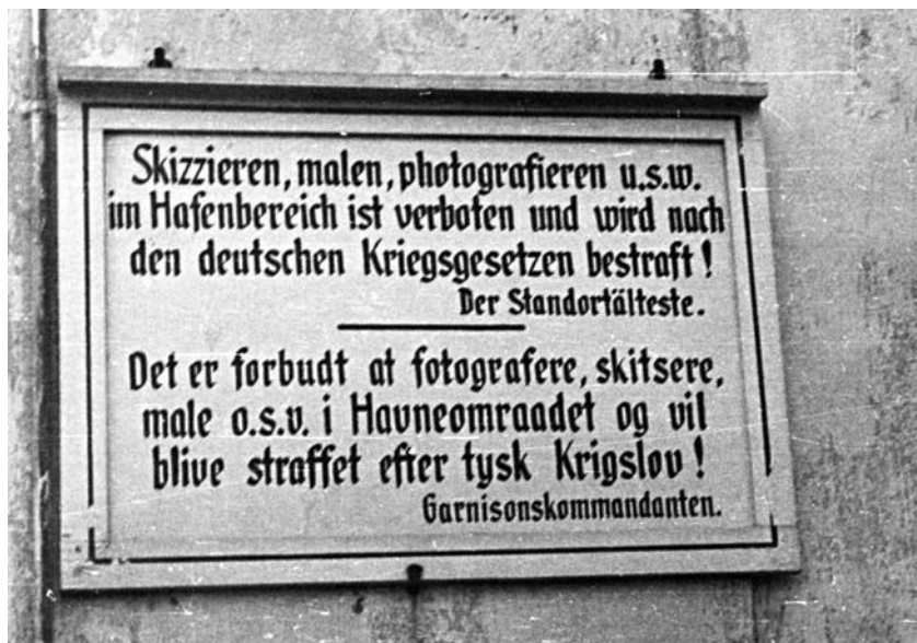
Det var spændende for en dreng at være "i fri leg" på havneområdet, men vi blev også med skiltning mindet om, at det ikke var helt ufarligt.

Om morgenen blev jeg sendt hen på Ahlmannskolen for – som det uskyldige barn, vel? – med tegnestifter at placere de maskinskrevne sedler med meddelelse om, at al skolegang var indstillet den dag. Da gårdinspektøren kaldte til samling med klokken, var der vist meget tyndt i rækkerne. Dermed var skolen også med i folkestrejken.