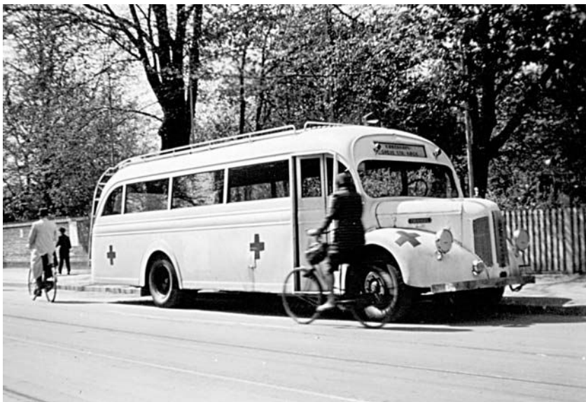
Hvad blev der pludselig af DSB's røde rutebiler i foråret 1945? De blev taget ud af drift og i hemmelighed malet hvide til den store redning af kz-fanger – som her en af de da gængse danskbyggede Triangler.

standsbevægelsen, og at han havde fået til opgave at finde ud af, om der var vagter ved Danfoss, og om man producerede noget for værnemagten. For der var planer i København om eventuelt at sabotere virksomheden, hvis ... Og ved madlavningen på stranden fik tropsføreren taget nogle fine billeder af de søde spejdere – med de hemmelige tyske anlæg på Hørup Klint i baggrunden. Sådan gav man som spejder uafvidende et lille bidrag til frihedskampen.