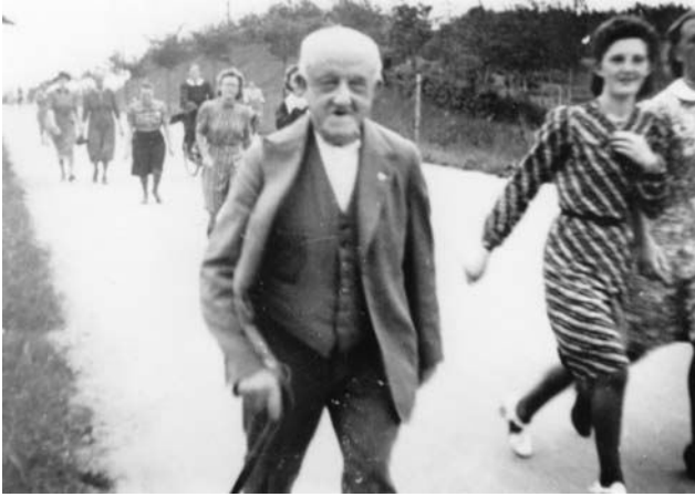
Ti kilometers algang ad Søndre Landevej blev virkelig en folkefest for unge og gamle – også en måde at vise sit danske sindelag på.