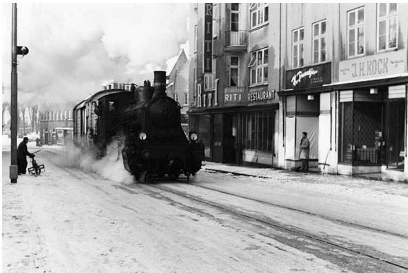
Rangermaskinen, den høje F'er, på vej med en kølevogn, der skulle læsses med smørdritler – antagelig til Tyskland – på bystationen. På returkørslen over broen til Sønderborg H. fik jeg ofte – rævestolt! – kørelighed.

ad bakken ved Kirketorvet, når der var mange vogne, og måtte have hjælp af mit yndlingslokomotiv, den høje schweizisk byggede rangermaskine F'er, der så måtte tilkaldes fra Sønderborg H og skubbe bag-på helt til bystationen.