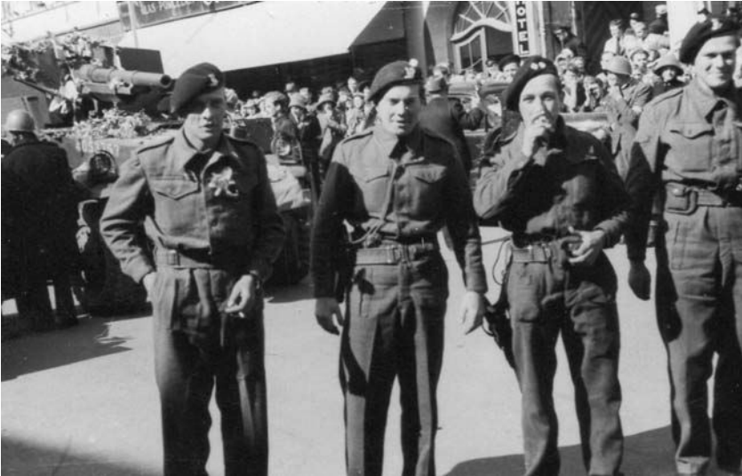
Fire af de glade tommy'er fra Royal Dragoons, som oplevede en heltemodtagelse i Sønderborg. De blev alle indkvarteret i private hjem – vi havde tre – og der blev kræset for dem med det bedste, vi havde.

8. maj kom briterne så til Sønderborg. En gruppe kampvogne fra Royal Dragoons trillede ind på Rådhusstorvet, og vi børn klatrede op på dem hujende og skrigende. Tommy'erne skulle indkvarteres privat, min far gaflede hele tre af dem. Vi ryddede børneværelset, de fik fuld rådighed over badeværelset, familien nøjedes med køkkenvasken, og der blev kræset ved bordet med det, man nu kunne få. En af soldaterne, den ældste, havde været med hele krigen som en af ørkenrotterne helt fra El Alamein via Sicilien og Normandiet via Tyskland til lille Danmark. »Vore« soldater bemandede en selvkørende kanon på larvefodder, der var stillet op på Strandpromenaden ved E Slotskaf for at bevogte ind- og udsejling til havnen, og jeg var den bare lykkelige ved at få lov til at sidde hos dem på køretøjet.