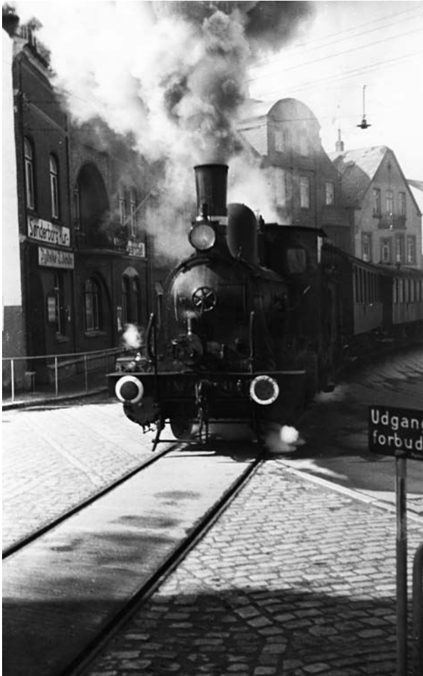
Mommarktoget for fuld damp ind på bystationen foran mit barndomshjem t.v. i Jernbanegade 7, hvor jeg dagligt stod på altanen og sugede indtryk til mig. Bemærk lokomotivets buffer. De skulle ligesom cyklernes bagskærme forsynes med hvid maling for bedre at kunne anes i mørket.

var bestilt til at fylde de huller ud med cement, der var indbygget i alle nyere danske vejbroer som forberedelse til sprængning – de provokerede. Det var første varsko. Andet da han erfarede, at der i tysksindede familier blev syet hagekorsflag og gjort flagstænger klar i tyskerfarver. Sidste kom, da han fik bekræftet sine oplysninger om