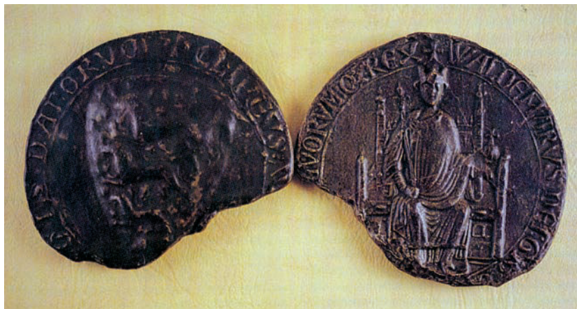
Valdemar II Sejrs segl fra 1216 viser på forsiden kongen med krone siddende på sin trone med scepter i højre hånd og rigsæblet i venstre hånd. Omskriften på seglet nævner kongens navn og titler.

mæssige udvikling i 1200- og 1300-tallet foregik ved bylovgivning og privilegier. Opneraa kan ses som kongemagtens ønske om en styring af samfundets handelsmæssige udvikling, hvor bebyggelsen kan have fået rollen som en regional port of trade . 101