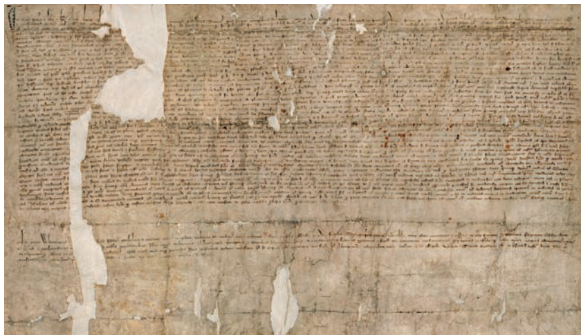
Aabenraa bys skrå fra 1335. Efter de mange tætbeskrevne paragraffer følger et større mellemrum og derpå hertug Valdemars stadfæstelse af skråen.

taget som kernen i den efterfølgende, men med tilføjelser ( wilkore ). 34