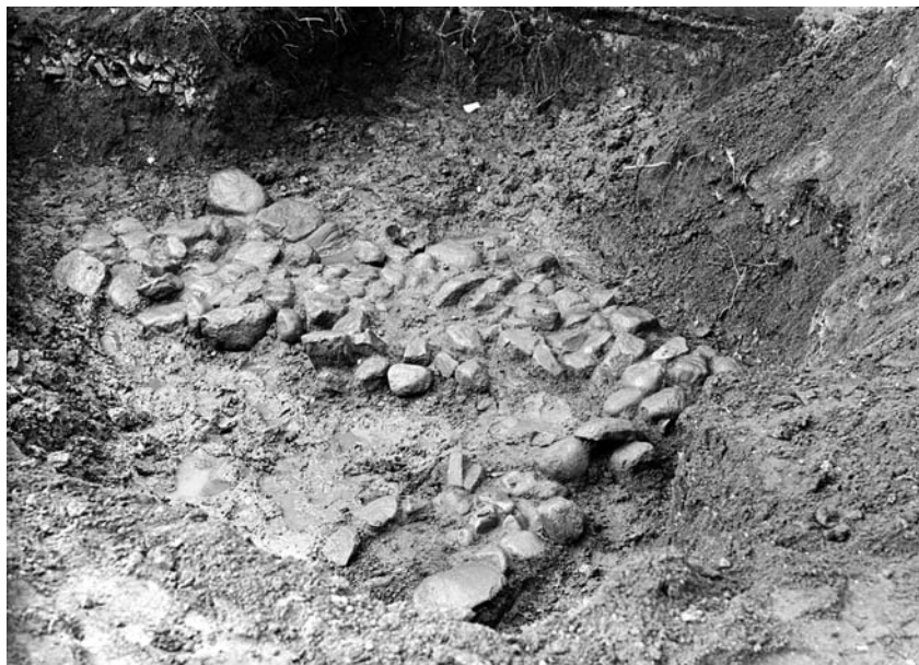
Ved udgravningen til en fjernvarmecentral i Humlehaven i Aabenraa i 1957 fandt arbejderne denne brolægning eller fundament, der må stamme fra den oprindelige kirke i Opneraa.