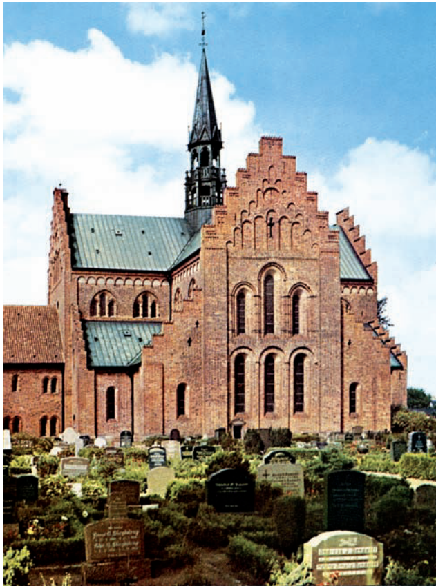
Løgum Klosterkirke fra 1200-tallet.

ren, fogeden og rådet efter deres skøn. Ribe stadsret (artikel 20 og 21) havde også udførlige bestemmelser om behandlingen af personer, der blev pågrebet med falske vægte eller mål til tørre eller flydende varer. Opneraas skrå §§ 44 og 45 fastsatte straffe for de samme forseelser. Ribe stadsret (artikel 27) rummede lige som skråen og Jyske Lov bestemmelser om drabet på en åbenbar horkarl. 81