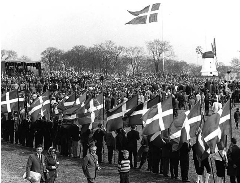
Fra mindearrangementet på Dybbøl Banke på 100-årsdagen for Slaget ved Dybbøl 18. april 1964.

med håb. 64 Forsoning og håb om fremtidigt samarbejde stod dermed også centralt i biskoppens tale.