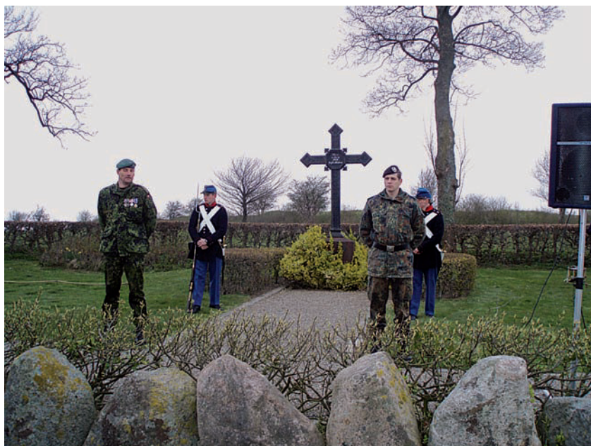
En dansk og en tysk soldat står sammen æresvagt ved en af fællesgravene under mindehøjtideligheden ved Dybbøldagen i 2012.

det dansk-tyske samarbejde i nutiden på dagsordenen, og 1989, hvor sergentskolens mulige lukning blev det tema, som flere talere valgte at lægge deres erindring og tolkning efter. Erindringssteder kan skifte betydning og ændre formål over tid, fordi det er den erindrende eftertid, der tillægger dem betydning.