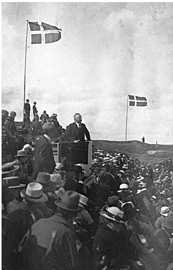
H.P. Hanssen taler ved genforeningsfesten på Dybbøl Banke den 11. juli 1920.