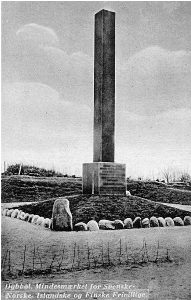
Mindesmærket for de nordiske frivillige opsat i 1936 på Dybbøl Banke ikke langt fra det tyske sejrsmonument, Düppel Denkmal.

dig kan man dog ikke udelukke, at oberst Sander også var sig den udenrigspolitiske situation bevidst, og at han derfor lagde vægt på forsoning snarere end forskelligheder og splittelse. I den forbindelse er det desuden værd at bemærke, at der ifølge avisen Hejmdal blev nedlagt fire kranser på fællesgravene. 46 På Dybbøl er der fire fællesgrave, en tysk og tre danske, og det må derfor tolkes på den måde, at