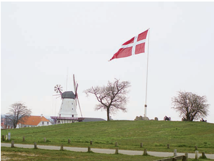
Det store Dannebrog flag vajer ved Dybbøl Mølle. På Dybbøldagen den 18. april hejses flaget kl. 8 om morgenen af sergentelever iført historiske uniformer (Dybbøldagen 2012).

heder, 1864 og Besættelsen, til at begrunde Danmarks indtræden i NATO: »Krigen i 1864 og Besættelsen den 9. april 1940 lærte os, at et lille land ikke har nogen ret til at forvente, at dets neutralitet vil blive respekteret. Det var den lærdom, som for 40 år siden bragte os med i NATO.« 88 Fra begyndelsen af 1980'erne og frem til 1988 var der et såkaldt alternativt flertal uden om Poul Schlüters borgerlige regering, hvilket gjorde, at der blev ført en sikkerhedspolitik, som regeringen ikke var grundlæggende enig i. 89 I 1988 blev der udskrevet folketingsvalg med henvisning til, at befolkningen skulle have mulighed for at tage stilling til landets fulde medlemskab af NATO. 90 Efter valget dannedes en VKR-regering, fortsat med Schlüter som statsminister. Ser man Enggaards tale på Dybbøldagen i lyset af dette, var talen en indirekte kritik af det tidligere alternative flertal samt et argument for hans egen regerings førte politik. Fortiden kunne tjene et nutidigt formål for forsvarsministeren.