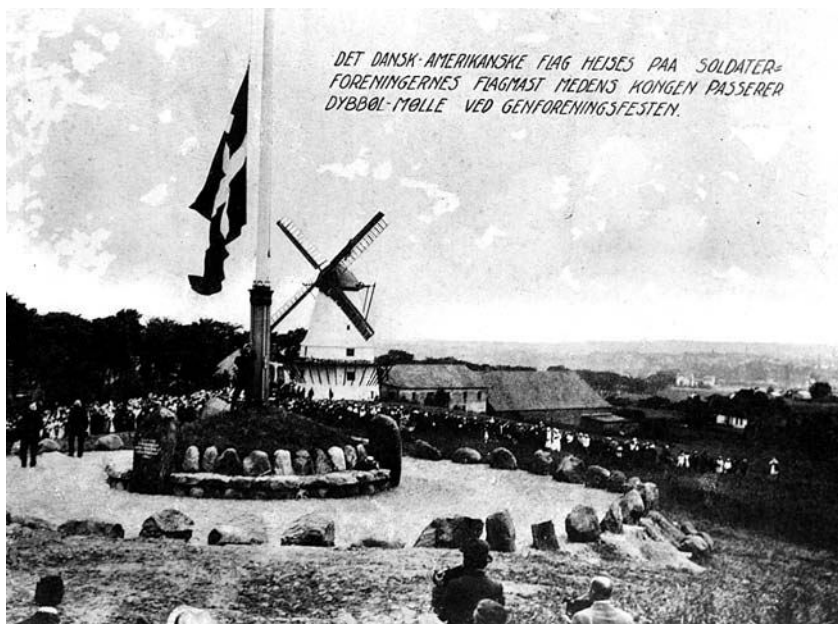
Dannebrog hejstes på den store flagstang på Dybbøl Banke, mens kong Christian X kørte forbi i forbindelse med genforeningsfesten den 11. juli 1920.

I Flensborg Avis blev der slået til lyd for, at det for sammenhængskraftens og oprejsningens skyld var bedre at have kæmpet forgæves end slet ikke at have kæmpet: »Vi sønderjyder ville nødigt være tvungne ind under fremmedherredømmet uden forsvaret på Dybbøl [...]« 21