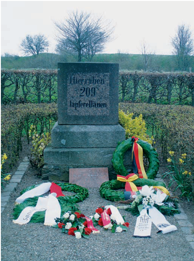
Danske og tyske kranser side om side ved den ene af de danske fællesgrave på Dybbøl Banke under Dybbøldagen i 2012.

Nogle erindringer havde et længere tidsperspektiv end en enkelt mindedags aktualisering. Der var erindringer og fortolkninger, som kunne genbruges, og her er det tapre og hæderfulde nederlag det tydeligste eksempel. På sin vis har denne erindring sin oprindelse i mindedagen i 1914, hvis formål det var at hædre og ære soldaterne fra 1864, men i 1939 antog det en mere heroiserende form som »Danmarks Thermopylæ«. At se nederlaget som ærefuldt og tappert er en erindring, som i forskellig grad fremkom ved alle mindearrangementerne. Fortolkningen og heroiseringen viser desuden, at erindringssteder