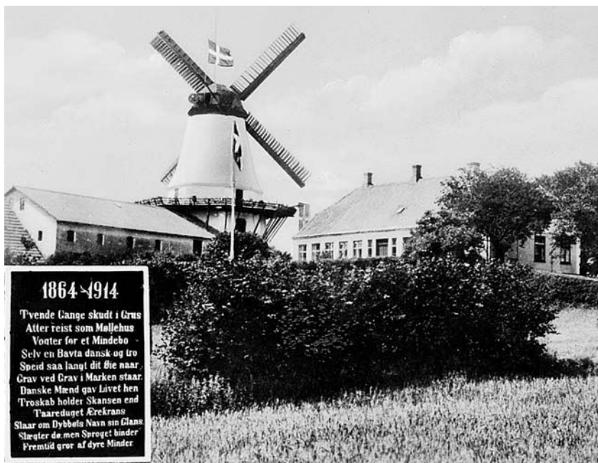
Dybbøl Mølle og mindepladen, der blev opsat den 18. april 1914. De preussiske myndigheder beordrede samme dag pladen fjernet. I 1919 kunne pladen igen opsættes på Dybbøl Mølle.

til Dybbøl, og for mere end én dansk er det først her ret gået op, hvad det vil sige at være dansk.« 12 Dansk nationalitet, identitet og erindring var hermed forankret i Dybbøl. Som det skal vise sig, var emnerne for taler og artikler særligt offervilje, fædrelandskærlighed og hæder af veteranerne.