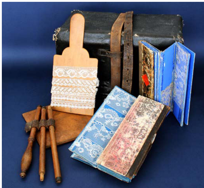
En kniplingskræmmers huserererskrin. Kræmmeren havde skrinet på ryggen, når han gik til marked. Foran skrinet ses dets indhold: Prøvebøger med kniplingsprøver, en delbar-alenstok og et viklebræt med kniplinger omkring.

gik. Anledningen var 250-året for salmedigteren H.A. Brorsons død, og emner i tilknytning til Brorson og pietismen prægede foredrag, musikaftener og mange andre arrangementer i årets løb. I forbindelse med udstillingen har der været afholdt mange rundvisninger, bl.a. for konfirmander.