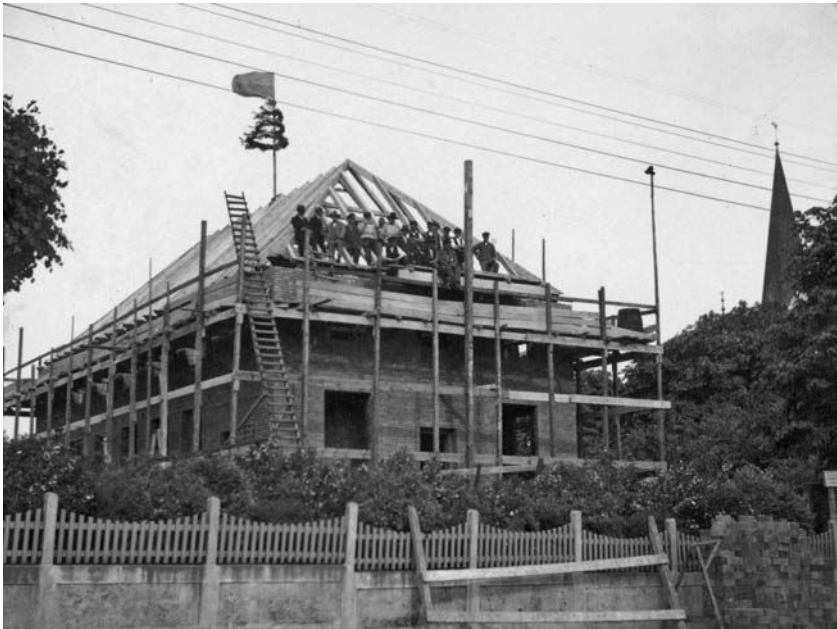
Ansgar Skolen, 1931. Bygningen med arbejdere og kransene på taget.

Disse kongresser blev fra 1925 og frem til 1938 afholdt hvert år. Kongresserne blev organiseret og afholdt, fordi man ønskede at danne en international institution, der varetog mindretallenes interesser i et Europa, der var præget af mange nationale mindretal. 47 Samtidig skal kongresserne ses i forhold og som alternativ til Folkeforbundet og dets bestræbelser på at opnå en garanti om mindretallenes beskyttelse. De europæiske nationalitetskongresser blev organiseret, udformet og afholdt af mindretallene i Europa, mens Folkeforbundet var en statslig institution. Et centralt formål med kongresserne var, at mindretallene selv varetog deres interesser og etablerede sig som selvstændige politiske aktører i en europæisk kontekst, og kongresserne skulle samtidig tjene som et forum for mindretallene i Europa. 48