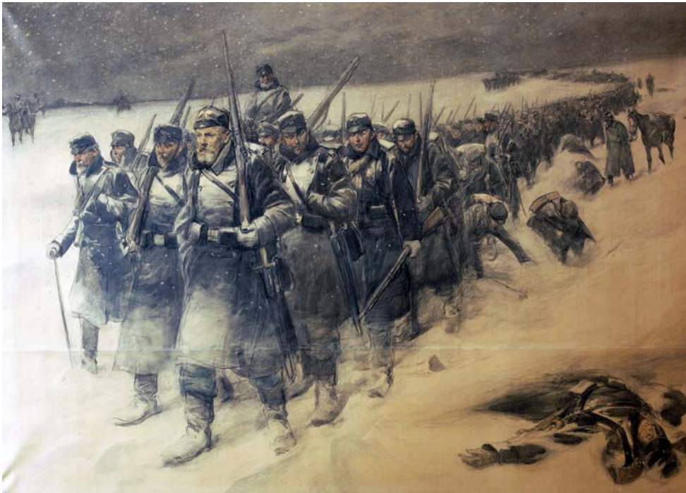
Erik Henningsen: Tilbage-toget fra Danevirke. 1914. Kultegnning på pap. 110 × 330 cm. Fanegemakket på Christiansborg Slot.

I modsætning til de danske historiemalerier, der blev udført i slutningen af 1800-tallet, er Erik Henningsens billeder fra 1864-krigen er uden patos og mere realistiske i stilen. Især hans skildring af tilbage-togets isnende kulde med døde soldater efterladt i sneen langs vejen er medrivende. Det er de menige soldater som anonyme helte, som dette billede viser. Vilhelm Dinesen, der deltog i tilbage-toget, har skildret det således: »Når vi kom op på en bakketop og så forud, bølgede, så langt øjet rækkede, en sort stribe langs landevejen som et uhyre ligtog, langsomt, død stille; det var den danske hær, der erkendte fjendens overmagt.«