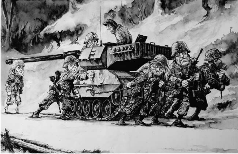
Roald Als: Tilbagetrækning af danske styrker fra Afghanistan. Bladtegning til Politiken 21. juli 2013. Signeret computerprint. 30 × 42 cm. Museum Sønderjylland – Sønderborg Slot.

Tegningen illustrerede en analyse af chefredaktør Bo Lidegaard om de danske troppers indsats i Afghanistan. Han konkluderede, at trods betydelige tab havde resultatet af indsatsen været tæt på nul. 4 Roald Als har lavet en parafrase over Niels Simonsens tilbagetog fra Danvirke (s. 32). Her trækkes kanonen af borgerlige politikere, der var ved magten, da danske tropper blev sendt til Afghanistan. Fra højre ses Anders Fogh Rasmussen, Per Stig Møller, Pia Kjærsgaard og Søren Gade. Siddende på kanonen og bag den ses tidligere oppositionspolitikere, der som regering videreførte den aktivistiske udenrigspolitik. Fra venstre ses Helle Thorning Schmidt, Niels Helveg Petersen og den rygvendte Villy Søvndal.