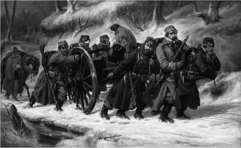
Niels Simonsen: Danske Infanterister trækker en Kanonlavet ved Tilbagetog fra Dannevirke Stillingen 1864. 1865. Olie på lærred. 48,5 × 80 cm. Det Nationalhistoriske Museum på Frederiksborg Slot.

Dette billede er selve ikonet på det danske tilbagetog. Det skildrer en konkret episode, hvor nogle danske infanterister valgte at slæbe af sted med en feltkanon, som var blevet efterladt ved vejkannten, efter at et hesteforspand var styrtet. En syg soldat blev sat op på kanonen og undgik herved at blive overladt til kulden og døden. Billedet er malet som en grisaille, dvs. kun i grå farver, men virker alligevel umiddelbart fængende i kraft af sin levende skildring af de ukuelige danske soldater, der trods tilbagetog og truende nederlag havde overskud til at tage vare både på kanoner og kammerater. Maleriet blev udstillet på Charlottenborg i 1865 og blev hurtigt folkeeje og gengivet i talløse reproduktioner.