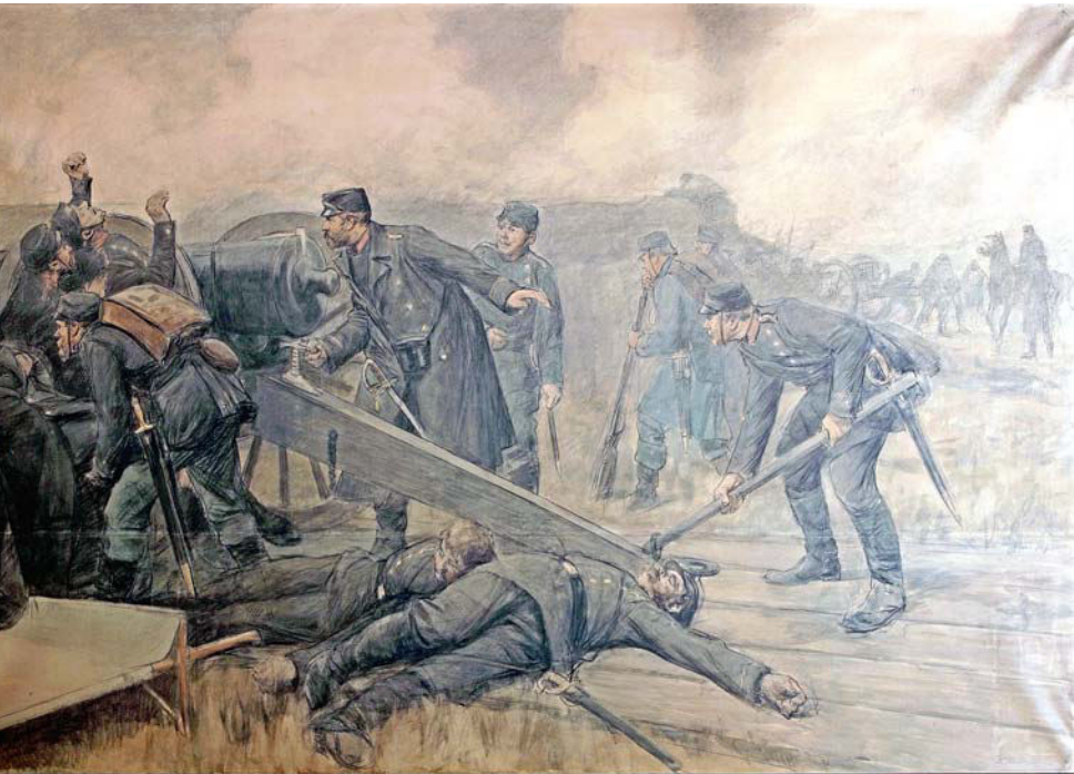
Erik Henningsen: Kampen ved Mysunde 2. februar. 1914. Kultegning på pap. 110 × 330 cm. Fanegemakket på Christiansborg Slot.

Ved genopførelsen af det nedbrændte Christiansborg Slot 1906-1928 blev kongefløjen udsmykket med kunst, der afspejlede både kongehusets og folkets historie. Det var værker af den type, som brygger J.C. Jacobsen havde betegnet som »vækkende Fremstillinger af det danske Folks historiske Minder«. 2 Audiensgemakket var førhen blandt de rum, som flest borgere havde mulighed for at opleve, og forrummet hertil, fanegemakket, blev i 1914 udsmykket med fire store billeder udført af Erik Henningsen. 3 De skildrede spektakulære begivenheder fra den tabte krig, der også har været yndede motiver for historiemalere.