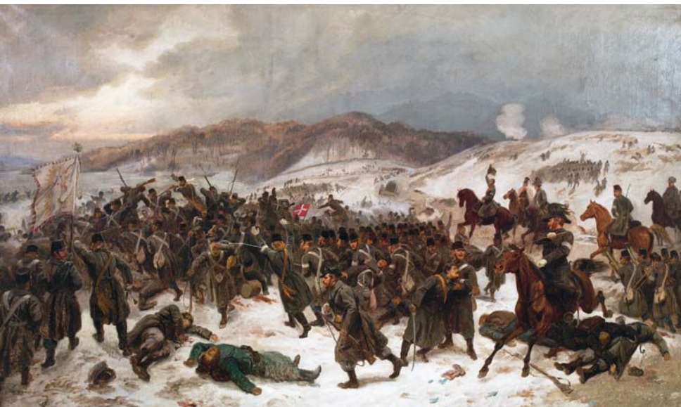
Ubekendt tysk maler: Fægtningen ved Oeversee. 1865. Olie på lærred. 116 × 179 cm. Schleswig-Holsteinische Landesbibliothek.