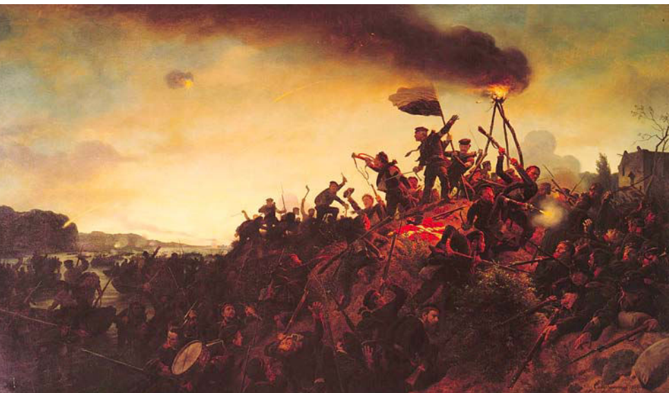
Wilhelm Camphausen: Overgangen til Als. 1866. Olie på lærred, 165 × 284 cm. Deutsches Historisches Museum, Berlin.

Camphausen var en fremtrædende tysk historiemaler allerede før 1864. Han rejste i april 1864 til Sundeved for at opleve krigens realiteter og udførte talrige skitser og skrev dagbog om sine oplevelser. Skitserne blev omsat til store oliemalerier, der blev udført på bestilling af den preussiske kongefamilie. De fleste er dog gået tabt i Anden Verdenskrig, men skildringen af den dristige overgang til Als 29. juni er bevaret. Motivet glorificerer triumfen, men giver dog et realistisk billede af, hvorledes de danske tropper blev løbet over ende. Camphausen udgav senere en illustreret dagbog med sine oplevelser i 1864, hvor han uforblømt skildrer krigens grusomheder, landskabets ødelæggelse og de såredes lidelser.