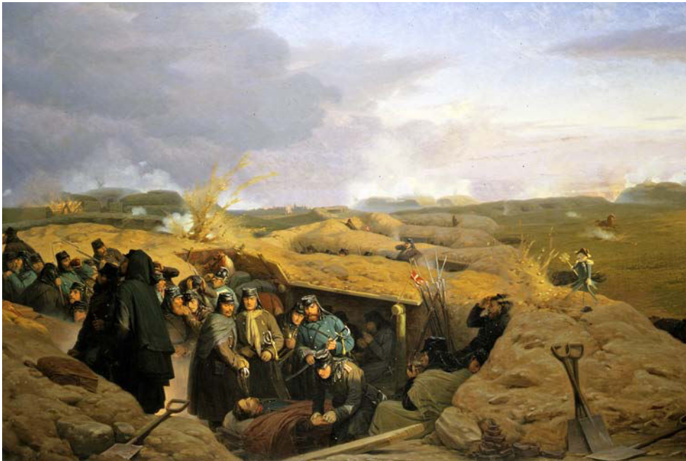
Jørgen V. Sonne: Fra Dybbøl først i april 1864. 1871. Olie på lærred. 130 × 194 cm. Det Nationalhistoriske Museum på Frederiksborg Slot.

Billedet viser de delvist sønderskudte skanser med en falden officer i forgrunden og konstante granatnedslag i baggrunden. Det afspejler en fortvivlende situation og et udsigtsløst forsvar. Sonne havde oplevet situationen, da han med tilladelse fra Krigsministeriet færdedes ved slagmarken med sin skitsebog. Hans skitser og oliemalerier har præg af troværdig krigsreportage, sædvanligvis dog uden gru og med hovedvægt på skildringen af de danske soldaternes mod og udholdenhed. Sonne har også udført talrige billeder fra 1848-1850, mens der fra krigen 1864 kun kendes tre værker. Det har været tungt for ham at få afsluttet skildringen af den håbløse situation på Dybbøl, og billedet blev først færdig i 1871.