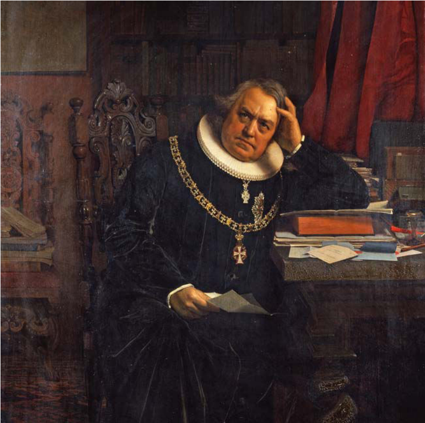
Johan Vilhelm Gertner: Ditlev Gothard Monrad. 1864. Olie på lærred. 179 × 122,5 cm. Det Nationalhistoriske Museum på Frederiksborg Slot.

D.G. Monrad overtog regeringsmagten ved årsskiftet 1863/64 og trådte først tilbage efter erobringen af Als. Portrættet er ejendommeligt ved at skildre en magthaver som afmægtig. Ligesom Hall har Monrad valgt at lade sig afbilde i sit arbejdsværelse. På bordet ligger et telegram fra fredskonferencen i London, antageligt med stormagternes sidste forslag til Slesvigs deling. I hånden holder han et andet telegram, måske fra den danske delegation i London. Monrad bærer magtens ydre kendetegn. Han er iført bispekjole, uagtet at han var blevet afskediget som biskop i 1854. Hans bryst er prydet med storkorsordenen, selvom han først modtog den efter afskedigelsen som regeringschef.