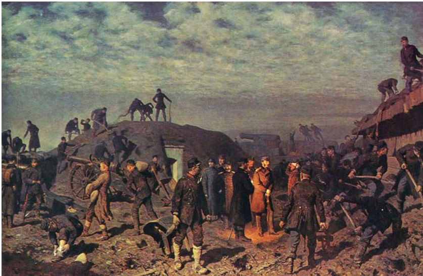
Otto Bache: Christian den Niendes Besøg i Dybbøl Skanser. 1888. Olie på lærred. 164 × 250 cm. Tilhører Hendes Majestæt Dronningen, deponeret på Sønderborg Slot siden 1976.