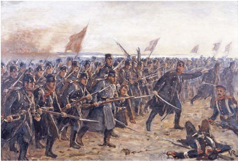
Vilhelm Rosenstand: Episode af Ottende Brigades Modstød. 1894. Olie på lærred. 71 × 102 cm. Skitse til stort maleri i Det Nationalhistoriske Museum på Frederiksborg Slot. Deponeret på Sønderborg Slot af Kunstmuseet Fuglsang.

Ottende Brigades ihærdige, men forgæves forsøg på at trænge de preussiske stormtropper tilbage den 18. april blev skildret litterært i 1889 af Vilhelm Dinesen, der som ung løjtnant deltog i denne kamp. Hans bog, Fra Ottende Brigade , der er skrevet i heroiserende stil, inspirerede Vilhelm Rosenstand til et stort slagmaleri, der i dag er på Det Nationalhistoriske Museum på Frederiksborg. Skitsen, der ses her, har ikke samme grad af patos som det endelige billede. Men fælles for dem er skildringen af soldaternes kampvilje på trods af udsigten til nederlag. Mandskabet i skanserne havde fra 7. februar ligget i dækning i stillingen, hvorfra der kun foretoget en enkelt offensiv 17. marts, der tilmed endte fatalt.