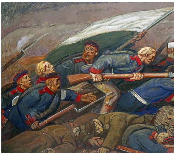
Ludwig Dettmann: Stormen på Dybbøl. 1914. Olie på lærred. Triptykon, midterste del måler 256 × 576 cm, sidefløjene 282 × 199 cm. Schleswig-Holsteinische Landesbibliothek.

I det nu nedrevne ridehus foran Sønderborg Slot blev der i 1914 vist en stor mindeudstilling i anledning af 50-årsdagen for slaget på Dybbøl og erobringen af Als. Her deltog den slesvig-holstenske kunstner Ludwig Dettmann med en triptykon, dvs. et maleri. I midterfeltet skildres stormen på Dybbøl Skanser, mens motiverne på sidefløjene perspektiverer kampen ved at skildre dens forudsætninger og følger. Det monumentale tredelte maleri, der måler ca. 10 meter i bredden, var mindeudstillingens dramatiske finale i det sidste rum, den såkaldte »Ehrenhalle«. Ikke mindst skildringen af fremadstormende preussiske soldater i heftig nærkamp med skræmte danske soldater under en overdimensioneret stormfane, vakte samtidens beundring.