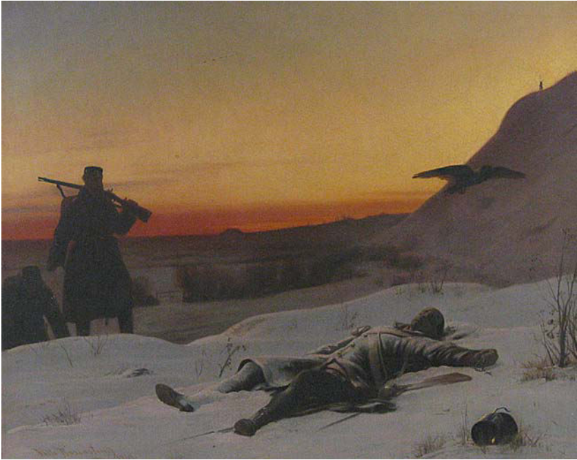
Vilhelm Rosenstand: Fra Saxarmen ved Danevirke Morgenen efter Kampen ved Bustrup 3. februar 1864. Olie på lærred. 66 × 82 cm. Museum Sønderjylland – Sønderborg Slot.