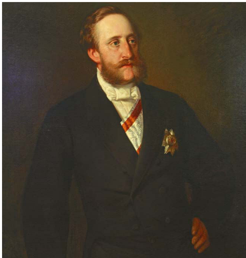
Carl Christian Magnussen: Herzog Friedrich VIII. 1863. Olie på lærred. 110 × 86 cm. Kunsthalle zu Kiel.

Hertug Friedrich har ladet sig afbilde som en statsmand med ordensbånd. Han er klar til at præsentere de augustenburgske arverettigheder til Slesvig-Holsten. Selvom Friedrich er malet imponant i trekvart figur, så fremstår han ikke helt med fyrstelig værdighed, for hans ansigtstræk har anstrøg af den ubeslutsomhed, der karakteriserede hans politik og optræden. Portrættet er malet af en af hans varme tilhængere, C.C. Magnussen, i sommeren 1863 under den optrækkende krise om hertugdømmerne.