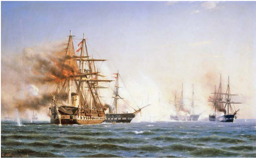
Carl Neumann: Slaget ved Helgoland . 1865. Olie på lærred. 64 × 103 cm. Fyns Stiftsmuseum, deponeret i Museum Sønderjylland – Sønderborg Slot.

Søslaget foregik 9. maj mellem to østrigske fregatter og tre preussiske kanonbåde over for to danske fregatter og en korvet. Maleren har skildret det øjeblik, hvor den østrigske fregat »Schwarzenberg« er skudt i brand, og den anden østrigske fregat glider frem for at dække den mod beskydning fra de to danske fregatter »Jylland« og »Niels Juel«. Kampen ophørte først, da den østrigsk-preussiske eskadre trak ind på neutralt farvand ved Helgoland. Det var den eneste større kamp i krigen 1864, der med rimelighed kunne tolkes som en dansk sejr. Derfor er den skildret både af samtidige og senere malere. Neumanns detaljerige billede bygger på en skitse af en søløjtnant, der var om bord på den danske korvet.