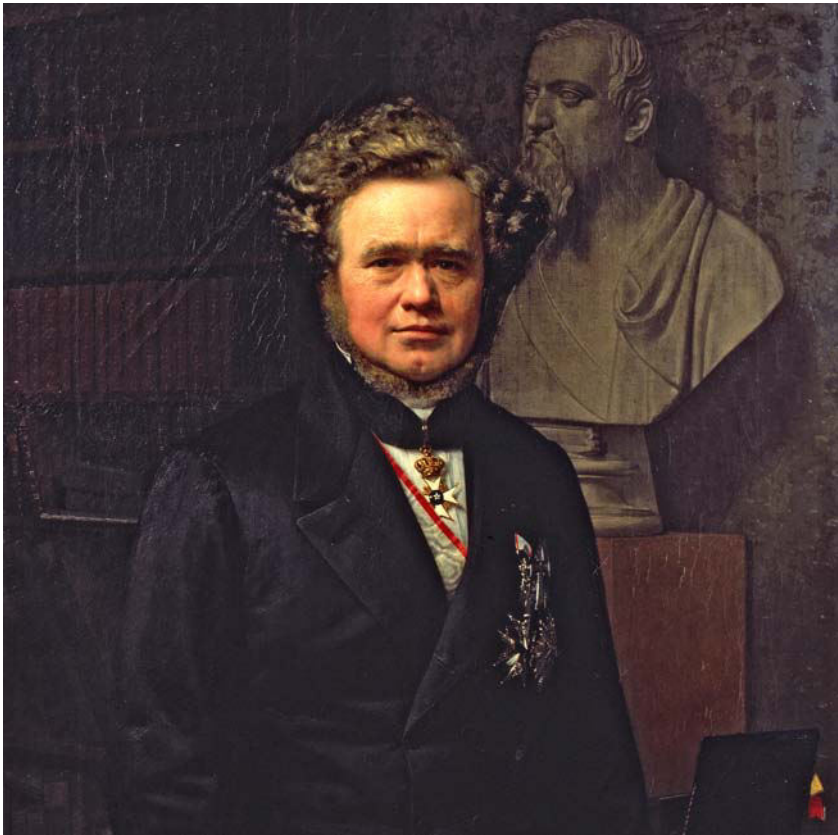
Johan Vilhelm Gertner: Carl Christian Hall. 1864. Olie på lærred. 126,5 × 88 cm. Det Nationalhistoriske Museum på Frederiksborg Slot.

C.C. Hall var statsminister 1857 til december 1863 med en afbrydelse på nogle måneder. Han gennemførte Novemberforfatningen, der var den umiddelbare årsag til krigens udbrud, og et eksemplar af den ligger på hans bord. I baggrunden ses en buste af Frederik VII, og hermed sendes et signal om, at Hall var i overensstemmelse med sin konge, også hvad Novemberforfatningen angik. Der er stor portrætlighed, men ingen indtrængende karakteristik. Han er skildret som den arbejdssomme statsminister med dekorationer, der afspejler påskønnelse af hans indsats for fædrelandet. Billedet er udført i 1864 og kan tolkes som Halls forsøg på at sikre sit eftermæle.