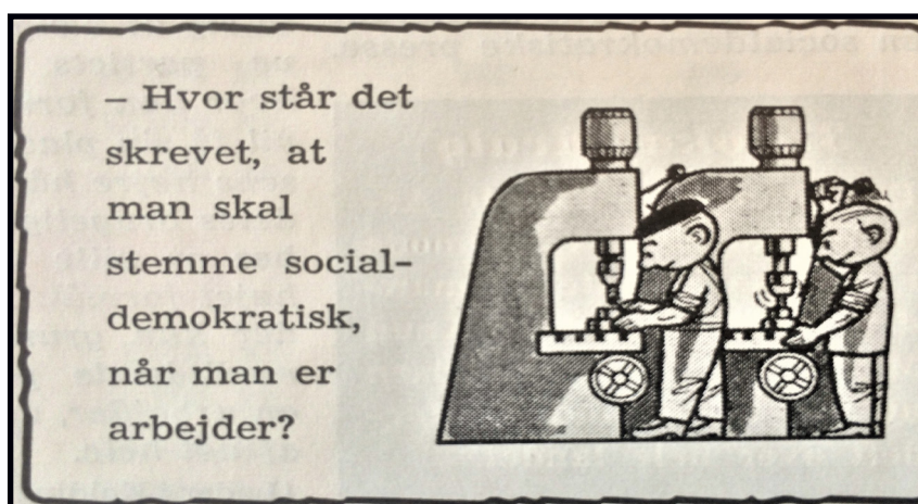
Valgannonce fra Den Liberale Arbejder , nr. 4, 1960

tid, hvor udviklingen ville vinde arbejderne for den liberale sag. Arbejderen blev i Venstres kommunikation knyttet til en ny tidslighed i dikotomien mellem et 'konservativt' og fortidigt Socialdemokrati og et 'moderne' Venstre, der tegnede fremtiden. Men hvor det i den socialistiske diskurs var arbejderne, der var den drivende kraft i at skabe en ny fremtid, blev det i den liberalistiske diskurs den teknologiske og økonomiske udvikling, der besad handlekraften, og som formede arbejderne ind i en uundgåelig liberalistisk mentalitet.