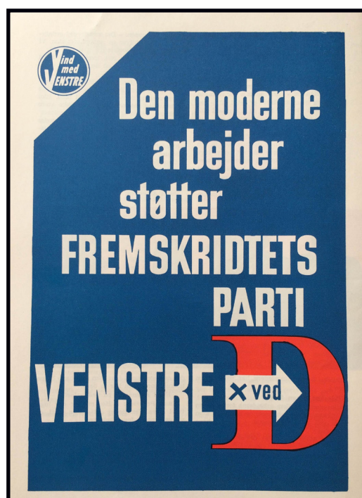
Bagsideannonce fra Den Liberale Arbejder, nr. 4, 1960.