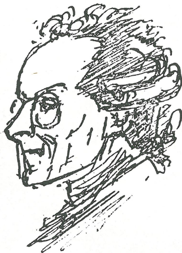
Portrait de Robespierre fait à la plume, par personnel Grand maître, à la séance du 9 Thermidor.

"Den franske republik fejrer hver tiende dag med fester som følger: 1: For det højeste væsen og naturen. 2: For mennesket. 3: For frihedens martyrer. 4: For friheden og ligheden. 5: For republikken. 6: For verdens frihed. 7: For fædrelandskærlighed. 8: For hadet til tyranner og forrædere. 9: For sandheden. 10: For retfærdigheden. 11: For blufærdigheden. 12: For æren og udødeligheden. 13: For venskabet. 14: For frugtbarheden. 15: For modet. 16: For ærligheden. 17: For heltemodet. 18: For uegennytte. 19: For stoicisme. 20: For kærligheden. 21: For den ægteskabelige troskab. 22: For faderkærligheden. 23: For den moderlige ømhed. 24: For datterkærlighed. 25: For barndommen. 26: For ungdommen. 27: For manddommen. 28: For alderdommen."