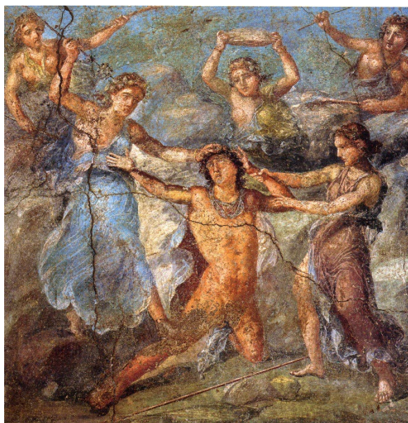
Mænaderne sønderlemmer Pentheus Romersk freske fra Casa dei Vettii (VI 15,1) i Pompeji

Normalt kan menneskene, de dødelige ( thnētoi ), ikke skue de udødelige ( athanatoi ) uden fatale konsekvenser, som det fx er tilfældet, da Selene får øje på sin elsker, Zeus, uden animalsk forklædning, eller da Aktaion uforvarende får øje på Artemis, der tager bad i floden. Selene rammes af Zeus' lynkile, og Aktaion forvandles til en hjort, der sønderlemmes af hans egne jagthunde. Et andet eksempel er det dionysiske vanvid, der kan ramme mennesker, hvis guden føler sig forurettet. Da kong Pentheus, som i Euripides' tragedie Bakkanterne ikke anerkender Dionysos som Gud (og han møder ham da også kun i skikkelse af et menneske), vækker han dennes vrede. Det fører i sidste ende til, at Pentheus der i skjul betragter Thebens bortløbne kvinder i ekstatiske tilbedelse af guden, bliver opdaget. Forblændede af guden ser kvinderne – eller rettere sagt: mænaderne (ordret: de vanvittige) – ham som en løveunge og lemlæster ham. Hans egen moder Agave vender stolt hjem med hans hoved på en stage, indtil vanviddet foretager sig, og hun i fortvivlelse opdager, at hun har slået sit eget barn ihjel (Bacch. 1641, jf. Haarløv 1985, 87). Dermed fuldbyrdes tragedien: Det synlige skifter karakter fra at have været underlagt gudens usynlige indflydelse og vender tilbage til den normale verdens reale udtryk. 7