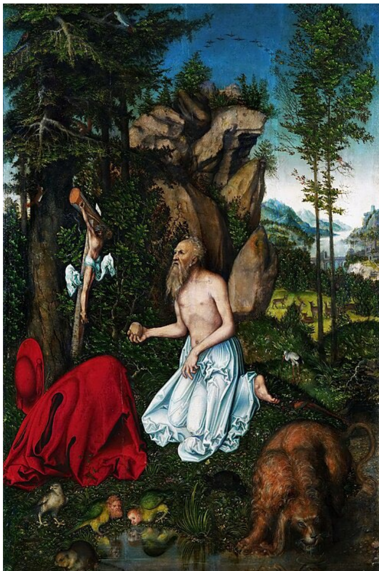
St. Jeronimus under sit bodsophold i naturen. Maleri på trætafle, tidsangivet til 1525. Det bærer ingen oprindelig signatur; men kunsthistorikere er enige om at betragte Cranach som dets ophavsmand.

Centralt i billedet knæler Jeronimus foran en repræsentation af den korsfæstede til venstre for billedets beskuer. Til højre nederst i billedet befinder løven sig foran en bæk, som den sammen med to harpyer 15 er i færd med at drikke af. I øvrigt indeholder