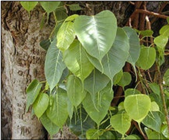
Figur 1. Peepaltræets hjerteformede blade, som ikke kun anses at have mindst 50 former for healende kvaliteter, de bruges også i ritualer og som repræsentant for forskellige guddomme.

Ser vi særligt på peepaltræet religionshistorisk, er der spor af peepal-trædyrkelse helt tilbage til induskulturen, da man har fundet segl afbildet med et peepaltræ ved de arkæologiske udgravninger som er foretaget af Mohenjo Daro, der udover Harappa var hovedsæde for Induskulturen. Seglene med peepaltræet er et godt udgangspunkt for at antage, at det dannede baggrund for en eller anden form for dyrkelse.