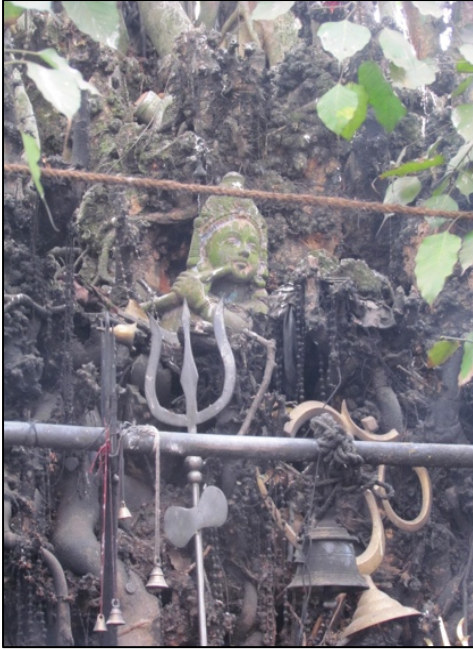
Figur 5. Peepaltræet dyrkes som trimurti, eller som repræsentant for en særlig guddom – her i form af Krishna, som er i træet.

Som nævnt findes der et stort antal af understøttende purana-tekster i.f.t. til trætilbedelse. Men idet purana-litteraturen med god ret kan siges at være påvirket af lokalt rodfæstede traditioner, er der også mange tribale træk i de mytologiske fortællinger, hvormed det nye gudpantheon (arkaisk træk) og trætilbedelse (tribalt træk) understøtter hinanden. Fx fortæller både Brahma purana og Padma purana, hvordan Vishnu gemte sig for dæmoner i et peepal-træ, før han endte med at bekæmpe dem. Derfor mener mange i dag, at det egentlig er Vishnu, man tilbeder, når træet tilbedes, selvom det i tribal sammenhæng vil være træet i sig selv, der tilbedes.