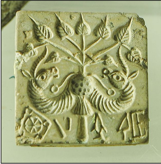
Figur 2. Segl fra Mohenjo Daro med et Peepaltræ omkranset af to monstrøse væsener, der mest af alt har enhjørningelignende træk.

Går vi til de første skriftlige kilder, kan vi allerede i Rigveda fra omkring 1200 f.v.t., finde mange eksempler på, hvordan peepaltræet synes at være et omdrejningspunkt for dele af kulten – både som en kommunikationsforbindelse til den anden verden, som baggrund for frugtbarhed og også som en repræsentant for guderne selv. Træet indgår derved i en prototypisk arkaisk religionsform. Et godt eksempel er følgende tekst fra Rigvedas 1. bog, hvor peepaltræet skildres som følger: