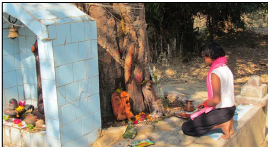
Figur 3. En pige udfører en kort puja (tilbedelse) på vej til skole (Allahabad, 2013.)

På mine snart mange feltrejser til Indien og til hinduer andre steder i verden har det altid slået mig, hvordan dyrkelsen af træer altid har været en helt central del af en hinduistisk lægmandspraksis. Der er i enhver landsby, og også gerne i de store byers gadehjørner træer, som tilbedes. Enten i sig selv, men ofte er der små gudestatuetter nedenfor placeret ved træets rødder, som også tilbedes. Den daglige tilbedelse (puja) foregår gerne hurtigt, fx tændes et lys, nogle udfører en hurtig cirkumambulation, hvis det er muligt i.f.t. træets placering og andre smører lidt rødt kumkum-pulver eller gult sandeltræspulver på træets rødder eller på de små gudestatuetter ved træets rod. Det foregår ofte til eller fra arbejde eller i forbindelse med et andet gøremål. Vigtigt er det, at den enkelte kan udføre sin ofring til træet selv uden en præst som mellemed. Det er altså en ikke institutionaliseret religionsform.