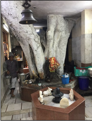
Figur 1 Billede fra et lille lokalt tempel midt i New Delhi. Templet er bygget op omkring et stort peepaltræ, der er centrum for tilbedelsen. Her også som repræsentant for Shiva.

Ser vi særligt på peepaltræet religionshistorisk, er der spor af peepal-trædyrkelse helt tilbage til induskulturen, da man har fundet segl afbildet med et peepaltræ ved de arkæologiske udgravninger som er foretaget af Mohenjo Daro, der udover Harappa var hovedsæde for Induskulturen. Seglene med peepaltræet er et godt udgangspunkt for at antage, at det dannede baggrund for en eller anden form for dyrkelse.