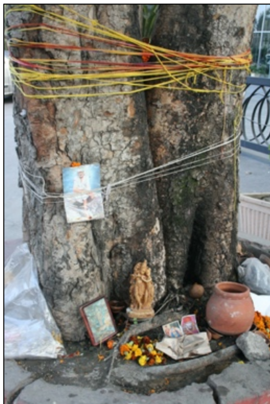
Figur 4. Peepaltræ i en sidegade i Delhi, hvor flere former for trådceremonier har fundet sted. Samtidigt udgør træet et tempel bl.a. for Sai Baba dyrkelse. (Foto: Marianne Qvortrup Fibiger, januar 2020).

Der er et stort antal af andre historier, som begrunder træets betydning, eller som skaber en brobygning imellem et tribalt og et arkaisk ideal. Overtagelsen af træet som centrum for en gudedyrkelse eller med en større emfase på det arkaiske bliver dog tydeligt, der hvor træet knyttes til tempelinstitutionen. Her bliver træet også i form af brænde brugt i de store ildofringsritualer (homa eller havan), hvor røgen derfra udover at være kommunikationsled til gudernes verden også menes at rense såvel de lokale omgivelser som de tilstedeværendes sind.